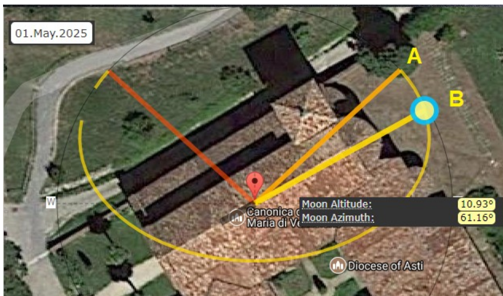
Figura 5: Simulazione con MoonCalc.org. A è la direzione di levata rispetto all'orizzonte astronomico, mentre B è quella rispetto all'orizzonte fisico. L'asse della chiesa coincide con la direzione B di levata della luna al lunistizio maggiore.

risultato è mostrato nella Figura 5. Effettivamente, la direzione dell'asse della chiesa corrisponde proprio all'azimut della luna, con corrispondente altezza di circa 11 gradi. L'ipotesi di un'orientazione della chiesa col lunistizio è quindi possibile. Nella Figura 6, vediamo una simulazione con Google Earth del punto di levata della luna.