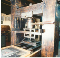
presse de Gutenberg