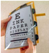
Ink's Electrophoretic Imaging Film