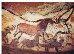
grotte de Lascaux

Après l'utilisation du coton pour améliorer la blancheur, celle des chiffes se développe très rapidement. Mais les coûts flambent et les fabricants reviennent au bois comme matière première. La cellulose est alors découverte grâce aux chimistes qui étudièrent les cellules végétales.