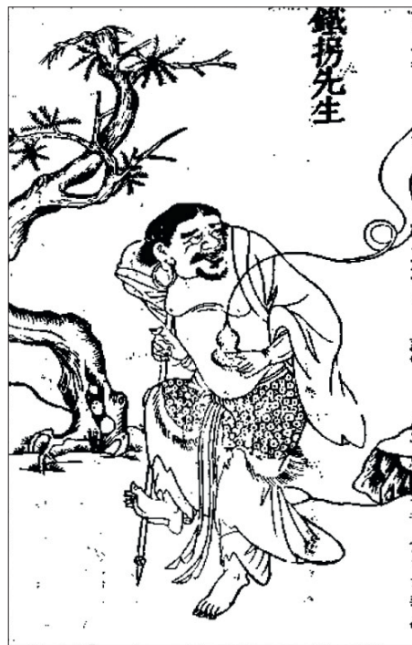
Figure 17. — Portrait de Li Tieguai 李鐵拐 in Wang Qi 王圻, Sancai tuhui 三才圖會, gravure du XVII e siècle. D'après Wang Qi, Sancai tuhui , Shanghai, Shanghai guji chubanshe, 1998 [facsimilé d'une édition de 1607], p. 782.

allant de villes en villages, où certains se produisaient dans des pièces de théâtre et des spectacles de rue, alors que d'autres mendiaient simplement. Il ne devait pas être rare à l'époque de rencontrer de tels personnages allant chercher leurs moyens de subsistance dans les centres urbains, surtout à l'occasion des fêtes locales. Les recherches effectuées par Tanaka Issei montrent effectivement que le goût du théâtre – souvent promu par des organisateurs professionnels ( baotou ren 包頭人), appartenant aux sociétés secrètes – se développe un peu partout aux XVII e et XVIII e siècles, y compris dans les plus petites villes. Ces spectacles étaient animés par des troupes d'amateurs ou d'artistes itinérants, plutôt que par des acteurs professionnels inscrits dans les registres des « foyers de musiciens » ( yuehu 樂戶) 48 . À ces occasions, liumin , mendiants ( qiqai 乞丐), et vagabonds ( youmin 遊民) s'illustraient dans des représentations licencieuses et potentiellement subversives aux yeux de l'État chinois. Ainsi de nombreuses lois locales furent adoptées pour contrôler, voire interdire, ces spectacles de rue, très populaires aux époques Ming et Qing 49 .