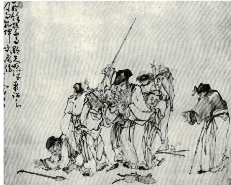
Figure 15. — Huang Shen 黃慎 (1687- ca. 1772), Rixe d'aveugles ( Qunmang jusong tu 群盲聚訟圖), 1744. Encre et couleurs sur papier, H. 67,3 cm ; L. 87,2 cm. Musée de la ville de Suzhou. D'après ZHONGGUO 1995, vol. 6, p. 93, pl. 1-372.

Paris, correspondent largement à l'idiome pictural de Huang Shen, dans lequel mendiants, artistes ambulants et aveugles occupent une place particulière 37 . Une de ses peintures, intitulée Rixe d'aveugles ( Qunmang jusong tu 群盲聚訟圖, 1744) met effectivement en scène une rixe entre musiciens aveugles, débarrassée toutefois de tout contexte mendiant (fig. 15). La place centrale de la composition est occupée par un aveugle, âgé, barbu et plus grand que les autres, brandissant sa canne, sans doute dans l'intention de frapper quelqu'un. Il est retenu par un autre aveugle, qui a saisi le bâton par l'autre bout. Les objets éparpillés au sol (des pièces de monnaie, une chaussure ainsi que des instruments de musique), contribuent à exacerber le caractère violent de la scène. Dans le poème pentasyllabique qui accompagne la peinture, Huang Shen indique la nature satirique de ce genre, se voulant une critique voilée du comportement des « lettrés corrompus » ( furu 腐儒) : « Ventre repu et sang chaud, des yeux comme deux perles ayant perdu tout éclat. Ils discutent sans arriver à se mettre d'accord ni même savoir à quel sujet. Le Ciel et la Terre rient des lettrés corrompus » (一腔熱血，兩顆失明珠。聚訟知何事，乾坤笑腐儒) 38 .