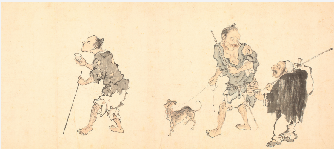
Figure 11. — Mendiants et personnages de rue (cf. fig. 5), détail. IHEC.