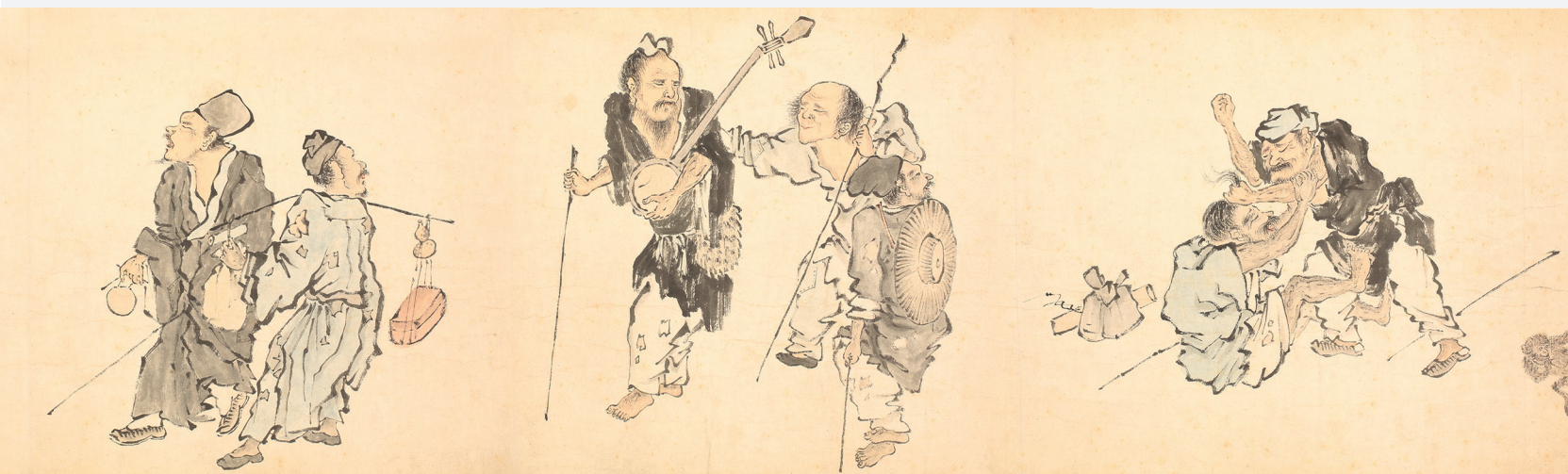
Figure 6. — Mendiants et personnages de rue (cf. fig. 5), détail. IHEC.