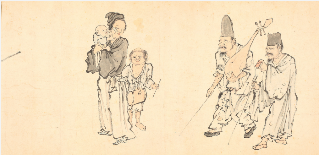
Figure 10. — Mendiants et personnages de rue (cf. fig. 5), détail. IHEC.