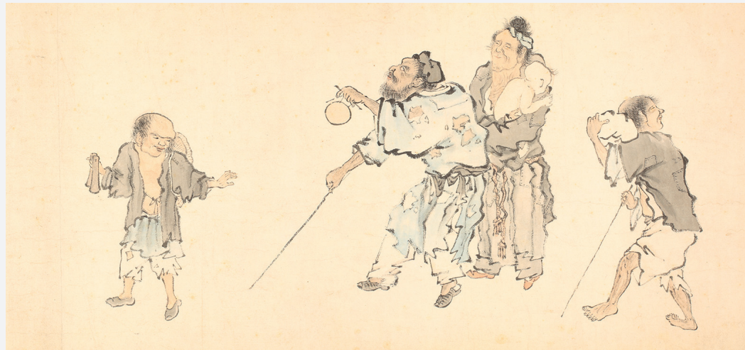
Figure 8. — Mendiants et personnages de rue (cf. fig. 5), détail. IHEC.

loin, nous apercevons un homme vu de profil, une vieille dame portant un bébé dans les bras et un vieil indigent marchant à l'aide d'une canne et tenant un petit tambour dans la main gauche (fig. 8). Les trois personnages sont aveugles. Ils sont précédés par un enfant jouant des claquettes qui suit trois individus (fig. 9). Une femme agite un petit tambour pour amuser un marmot porté sur les épaules d'un homme. La scène semble plus divertir l'adulte que le bambin, qui regarde dans la direction opposée. Deux gamins, dont l'un porte un lapin sur les épaules, observent la scène. Devant eux, se tiennent trois hommes : un charmeur de serpents et deux mendiants portants des bols à aumônes. Ce trio figurait déjà dans les rouleaux de Londres (fig. 2). La scène qui suit dépeint une femme et deux enfants vers lesquels s'avancent deux aveugles (fig. 10). Ces personnages trouvent leurs homologues dans les rouleaux B1 (fig. 1) et B2, bien que le