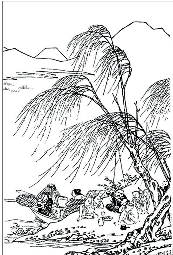
Figure 19. — Gu Bing 顧炳, Gushi huapu 顧氏畫譜, gravure du XVII e siècle. D'après ZHENG Zhenduo 鄭振鐸 (éd.), Zhongguo gudai banhua congkan 中國古代版畫叢刊, Shanghai, Shanghai guji chubanshe, 1988, vol. 3 [fac-similé d'une édition de 1603], p. 369.

subversives dans leur conception de la société. Ainsi, par analogie avec les Yule tu , le rouleau B1 pourrait être considéré comme subversif de la même manière que les peintures des joies des pêcheurs 65 . Richard Barnhart propose d'ailleurs d'interpréter cette œuvre comme une parodie de la vie lettrée : « It is even possible that the strolling entertainers were meant as a parody of officialdom and court life in general » 66 . Cette hypothèse semble être confirmée par la présence de scènes comiques et grotesques dans notre corpus. Elle se précise si l'on considère qu'au moins à partir de la fin des Ming, il devient assez commun d'associer les aveugles (mendiant et musicien en particulier), au concept d'ignorance ou de stupidité des voyants. La cécité des aveugles devenait alors parabole de l'aveuglement intérieur ou spirituel 67 . Le Propos sur un aveugle ( Mangzhe shuo 盲者說) de Dai Mingshi