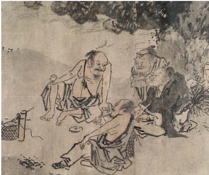
Figure 18. — Les Errants (B1) (cf. fig. 1), scène 6, détail. British Museum.

corpus pourraient représenter par métaphore des lettrés, tour à tour se disputant, puis se réjouissant 62 . Dans cette hypothèse, les peintures seraient déjà porteuses d'un message politique, celui du refuge dans la nature, à la manière de ces mendiants et artistes itinérants, qui, tels les pêcheurs, étaient libres de vivre dans la nature et de se déplacer d'un lieu à l'autre, échappant ainsi aux pressions et aux contraintes propres à la carrière bureaucratique. Des peintures illustrant la vie des pêcheurs ou des bûcherons, parfois teintées d'une veine humoristique, connurent une vogue particulière sous les Ming, et furent popularisées par Wu Wei. Elles devaient être particulièrement appréciées par les riches lettrés de la région du Jiangnan, où nombre d'artistes de l'école de Zhe étaient actifs à l'époque 63 . Toutefois, si nous admettons l'hypothèse de Richard Barnhart, les scènes produites par Wu Wei et ses successeurs, en suggérant une forme de communautarisme similaire à celle proposée par le Shuihu zhuan 水滸傳 ( Au bord de l'eau ) 64 , où hommes et femmes partagent le travail sans aucune forme de hiérarchie ou d'exploitation, pourraient être presque