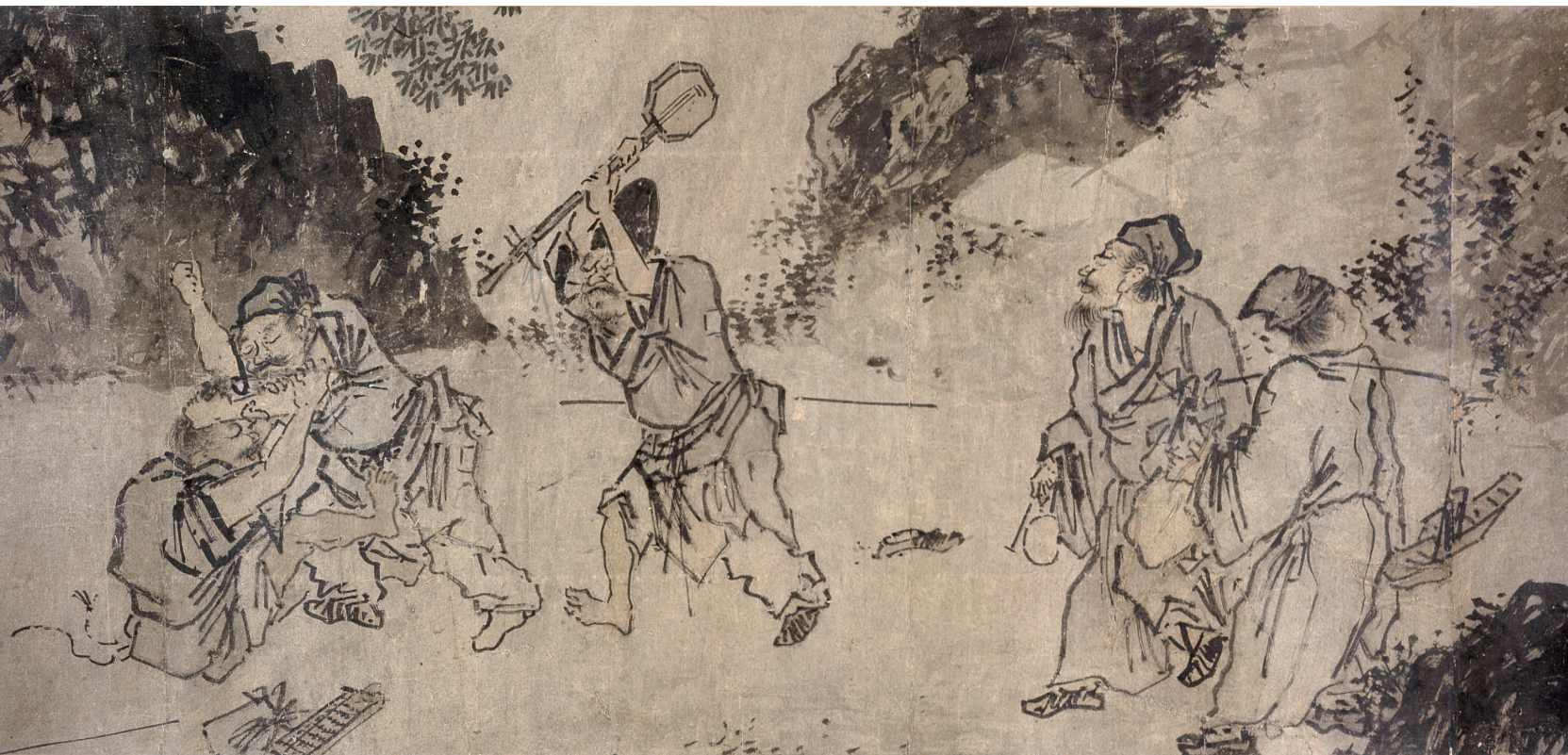
Figure 3. — Les Errants (B1) (cf. fig. 1), scène 5. British Museum.