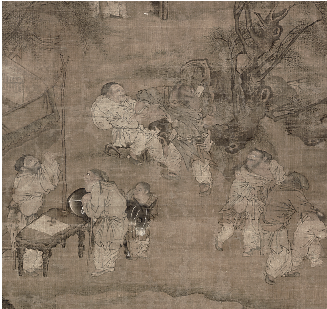
Figure 14. — Anonyme, Aveugles se disputant à l'ombre d'un saule ( Liuyin qunmang tu 柳蔭群盲圖), détail, XIII e siècle. Encre et couleurs sur soie, H. 82 cm ; L. 78,6 cm. Musée du Palais, Pékin.

L'aspect caricatural est accentué notamment par des expressions grimaçantes et un plus grand nombre de scènes de dispute. La palette de couleurs utilisée pour peindre les visages aux lèvres rouges, aux bouches grandes ouvertes qui exhibent leurs dents, met en relief leurs traits grotesques. Les personnages sont peints selon deux techniques, l'une utilisant des traits fins, légers et précis pour les visages et les parties visibles du corps, l'autre employant des traits d'encre épais rapidement brossés, pour marquer le mouvement simplifié des drapés, au lavis pour les surfaces des robes. L'encre est utilisée pour tracer les contours des visages mais aussi en dégradé pour faire ressortir les traits ou les rides des personnages. Des ombres légères, sur les vêtements et les chairs, renforcent l'effet de volume. Une attention particulière est portée aux corps, notamment pour souligner la tension musculaire de certains individus (le charmeur de serpent, ici torse nu, les bagarreurs). En dépit du traitement, parfois exacerbé, des traits des visages, le rendu des personnages témoigne d'un sens de l'observation qui accentue le réalisme de la représentation.