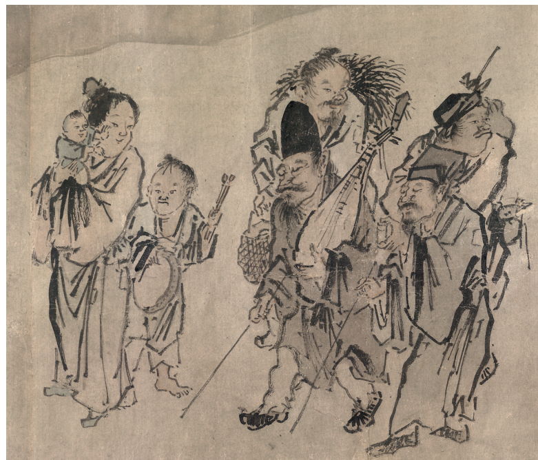
Figure 1. — Wu Wei 吳偉 (1459-1508) (attribué à), Les Errants ( Liumin tu 流民圖) (B1), scène 2, fin de l'époque Ming (1366-1644) (?). Encre et couleurs sur papier, H. 37,7 cm ; L. 546,5 cm. British Museum, inv. 1965,0724,0.8.

L'œuvre, tenant à la fois du paysage et de la peinture de genre, s'ouvre sur un groupe de trois personnages. Un enfant indique à la femme qui le précède une scène se déroulant en dehors de l'espace pictural. La femme, vue de dos, marche en s'aidant d'un bâton, et semble rappeler l'enfant à elle, tandis qu'un homme s'avance en regardant derrière lui. Il porte sur son dos un panier de bambou, duquel sortent des drapeaux. Un singe est accroupi sur le panier. Dans la main gauche, il tient un tambour, et la baguette qu'il empoigne de la main droite lui sert à le frapper pour signaler sa présence dans les rues qu'il parcourt. Il s'agit sans doute d'un dresseur de singes ( shuahou'er 耍猴兒), tel que nous le voyons dans d'autres peintures de même sujet 15 . La scène qui suit ( fig. 1 ) dépeint une femme et deux enfants vers lesquels s'avancent quatre personnages, dont deux aveugles. L'un d'entre eux est un musicien coiffé d'un bonnet noir, tenant dans une main un luth ( pipa 琵琶) et dans l'autre une canne. Sa posture, ses vêtements et l'instrument qu'il porte sont à rapprocher avec d'autres figurations d'aveugles 16 . L'autre, vêtu d'une robe taoïste,