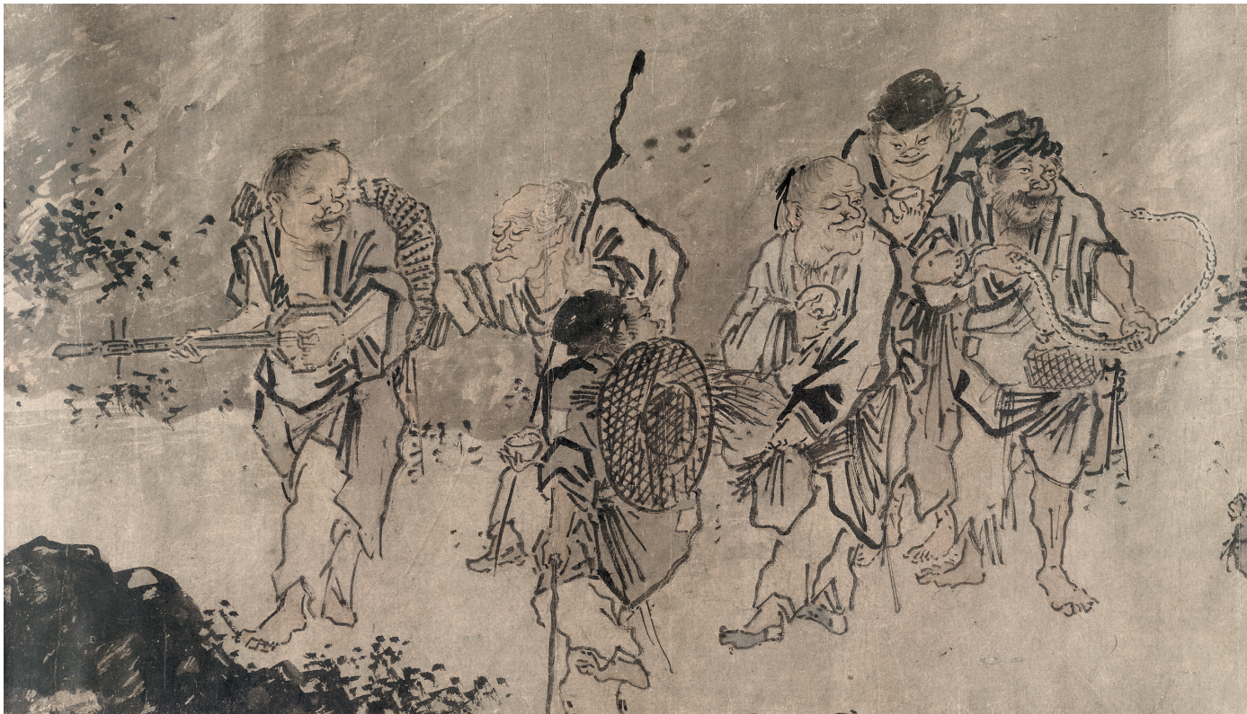
Figure 2. — Les Errants (B1) (cf. fig. 1), scène 3. British Museum.

du luth sanxian 三弦. Apparaissent ensuite deux personnages en robe taoïste, aux postures se faisant écho (fig. 3) : l'un vu de dos, la tête tournée vers la droite, porte sur les épaules une planche à laquelle sont suspendus un bateau miniature 18 et un ballot ; l'autre, de profil, est aveugle et tient un gong dans la main. La scène qui suit constitue le point culminant de l'œuvre : il s'agit d'une dispute entre trois mendiants. L'un d'entre eux, tombé par terre, essaie d'éloigner son agresseur en s'aidant des mains et des pieds. L'autre homme, debout, lui tire les cheveux et s'apprête à lui asséner un coup. Un troisième personnage est sur le point de frapper les deux bagarreurs avec un sanxian . Dans le feu de l'action, il a même perdu l'une de ses chaussures. Par terre, à côté des deux lutteurs, se trouve un abaque à boules ( suanzhu 算珠), probablement l'objet même de la querelle 19 .