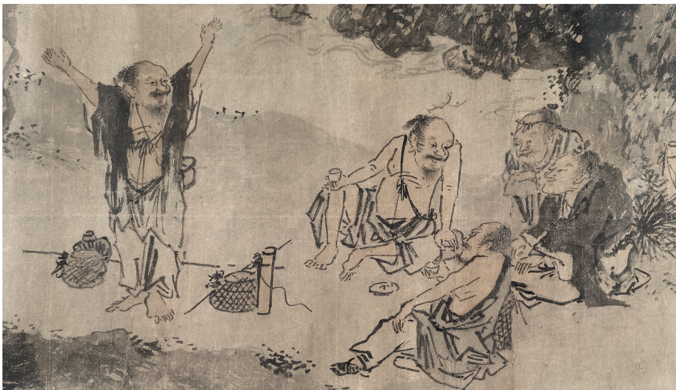
Figure 4. — Les Errants (B1) (cf. fig. 1), scène 6. British Museum.