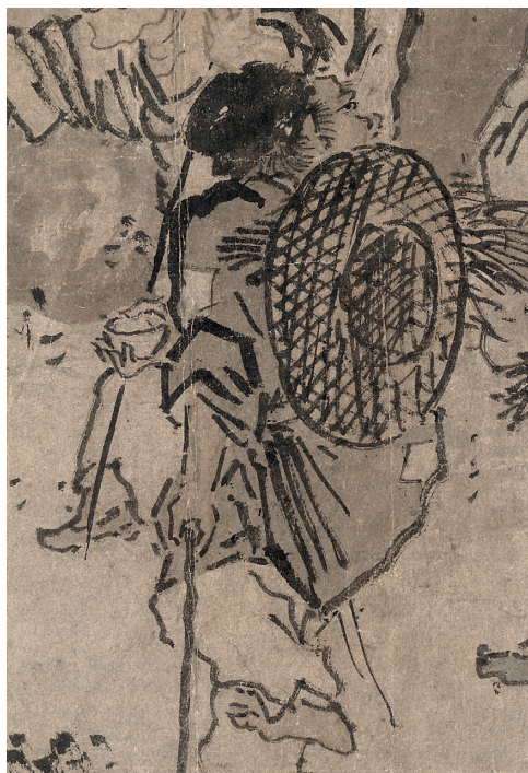
Figure 16. — Les Errants (B1) (cf. fig. 1), détail. British Museum.