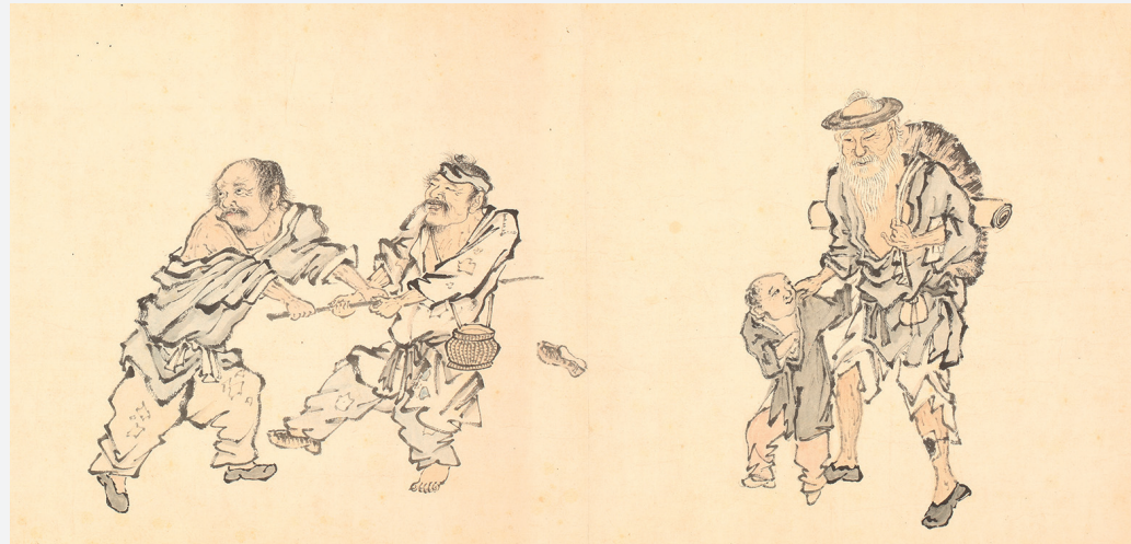
Figure 12. — Mendians et personnages de rue (cf. fig. 5), détail. IHEC.