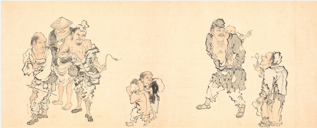
Figure 9. — Mendiants et personnages de rue (cf. fig. 5), détail. IHEC.