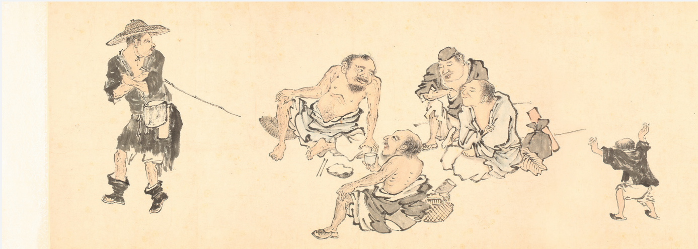
Figure 13. — Mendians et personnages de rue (cf. fig. 5), détail. IHEC. Photo IHEC/Collège de France © 2014.

se disputant à l'ombre d'un saule ( Liuyin qunmang tu 柳蔭群盲圖), est conservée au musée du Palais de Pékin 34 (fig. 14). Les deux aveugles tirant une canne par les deux bouts sont placés au centre de la composition. Leurs postures sont quasiment identiques à celles de leurs compères du rouleau de Paris ; le bâton qui les relie est également à l'horizontale 35 . Au premier plan, à droite, un troisième aveugle s'apprêtant à rejoindre la bagarre, est retenu par un enfant et deux adultes. À gauche, un homme âgé accompagné par son domestique, s'est arrêté devant