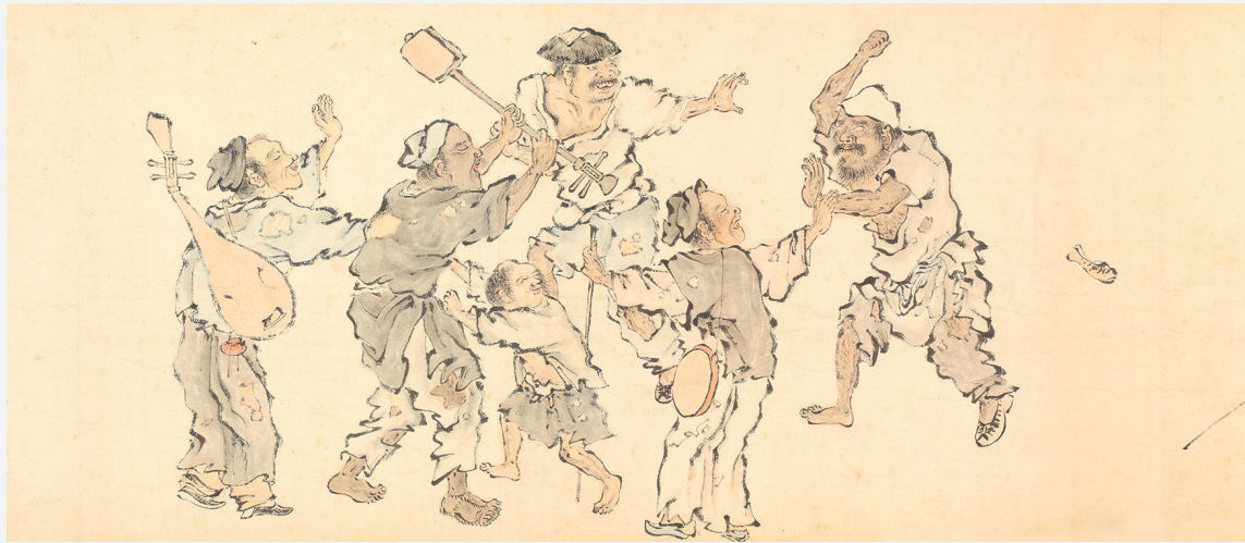
Figure 7. — Mendiants et personnages de rue (cf. fig. 5), détail. IHEC.