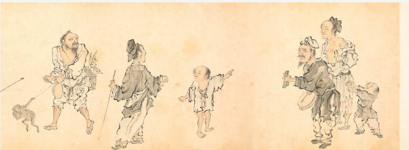
Figure 5. — Anonyme, Mendiants et personnages de rue , détail, époque Qing, XVIII e -XIX e siècle (?). Encre et couleurs sur papier, H. 36 cm ; L. 1075 cm. Bibliothèque de l'Institut des hautes études chinoises, inv. 54844.