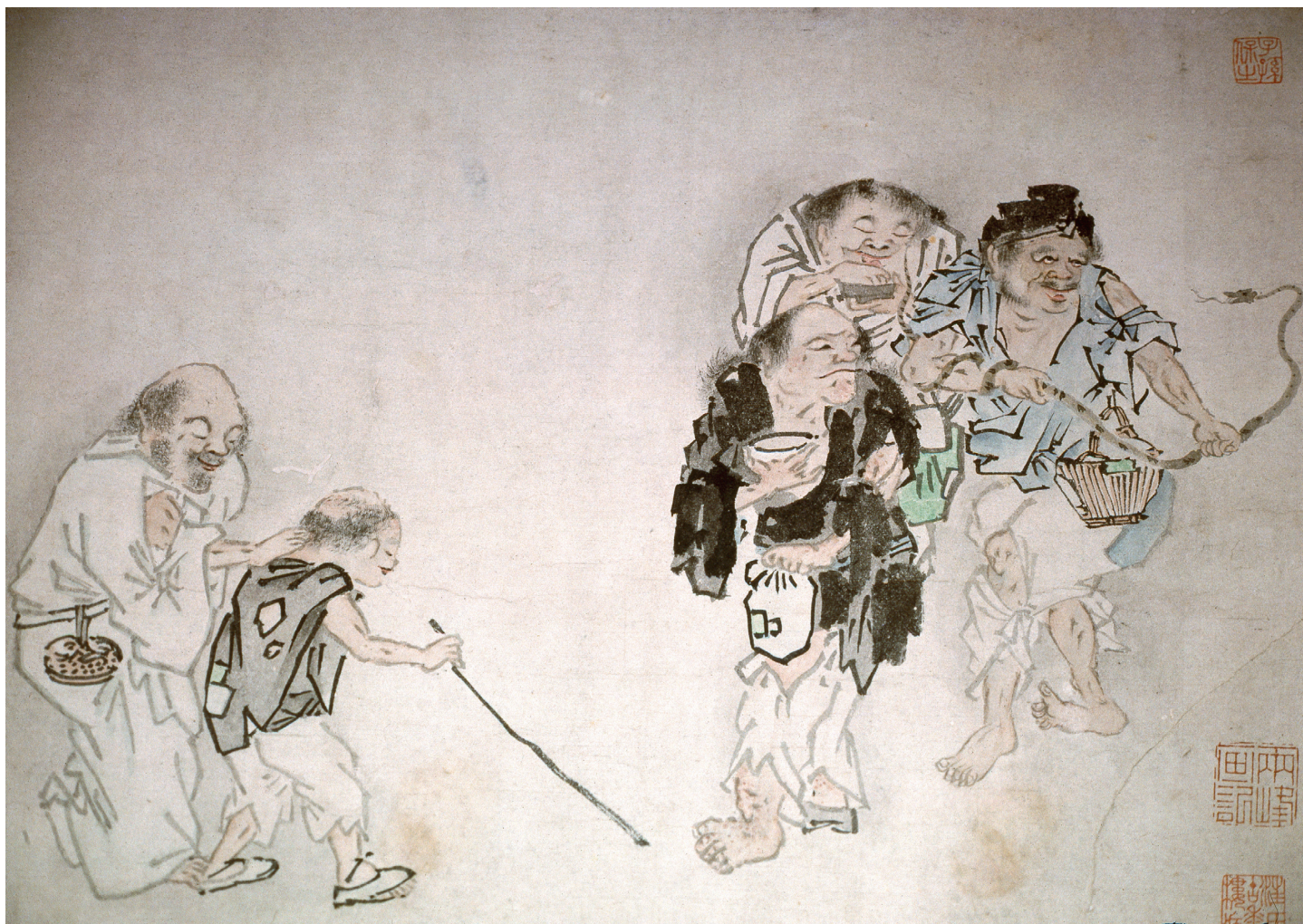
Figure 20. — Anonyme, Les Cent Mendiants ( Baigai tu 百丐圖), détail, xx e siècle (?). Encre et couleurs sur papier, H. 29,9 cm ; L. 322 cm. Collection particulière.

戴名世 (1653-1713), dont il sera question plus loin, est un bon exemple de cette tendance 68 . Ce discours trouve un parallèle iconographique significatif dans des peintures qui apparaissent à cette même époque. Aussi, une peinture de Zhang Chong 張翀 (actif ca. 1628-1651), intitulée Ignorance ( Kuikui tu 瞶瞶圖), datée de 1642 et exécutée dans le style de Wu Wei, met en scène un groupe de personnages dont les attributs iconographiques renvoient à certains détails de nos peintures : sont figurés un aveugle avec une canne, deux garçons et une jeune fille portant un pipa sur les épaules 69 . Ces œuvres sont à comprendre comme des commentaires sociaux s'adressant non pas aux « infirmes », mais plutôt à l'élite et à la classe lettrée 70 . Ainsi Huang Jishui 黄