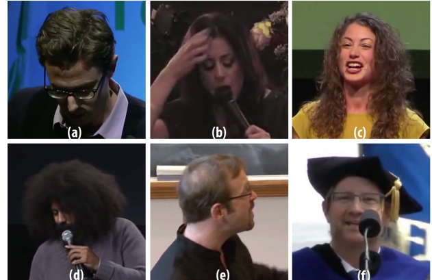
Figure 2 – Illustration des défis rencontrés en conditions non contrôlées : occultations (b), (d), (f), variations de pose (a), (e), éclairage (a), (b), expressions (c). Images issues de 300VW [?].

Aujourd'hui, du fait notamment de l'émergence des techniques d'apprentissage profond, il peut être nécessaire de disposer d'un grand nombre d'images annotées, ce que ne permettent pas forcément les jeux de données existants. Dans la littérature, différents procédés d'augmentation sont utilisés pour contourner ce problème. Certaines opérations peuvent être appliquées sur les images afin d'en générer de nouvelles (par ex., rotation, inversion horizontale, perturbation de la fenêtre de détection). D'autres procédés plus complexes tels que la génération d'images de synthèses commencent également à être employés [?].