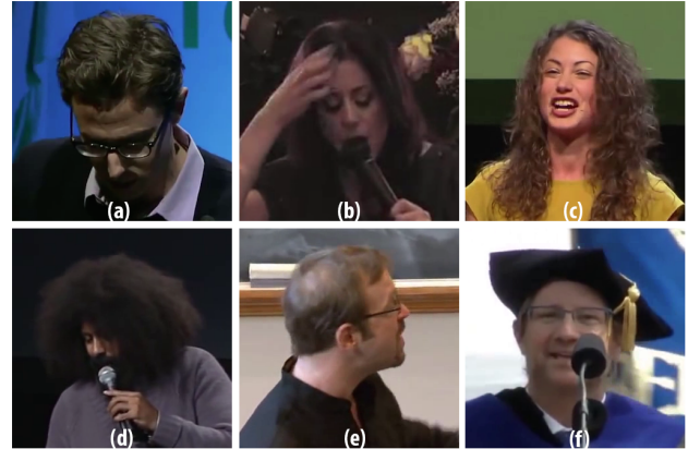
Figure 2 – Illustration des défis rencontrés en conditions non contrôlées : occultations (b), (d), (f), variations de pose (a), (e), éclairage (a), (b), expressions (c). Images issues de 300VW [?].

Aujourd'hui, du fait notamment de l'émergence des techniques d'apprentissage profond, il peut être nécessaire de disposer d'un grand nombre d'images annotées, ce que ne permettent pas forcément les jeux de données existants. Dans la littérature, différents procédés d'augmentation sont utilisés pour contourner ce problème. Certaines opérations peuvent être appliquées sur les images afin d'en générer de nouvelles (par ex., rotation, inversion horizontale, perturbation de la fenêtre de détection). D'autres procédés plus complexes tels que la génération d'images de synthèses commencent également à être employés [?].