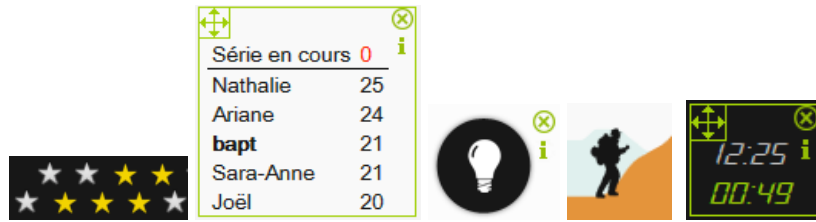
Figure 3 • Capture d'écran des 5 fonctionnalités implémentées.