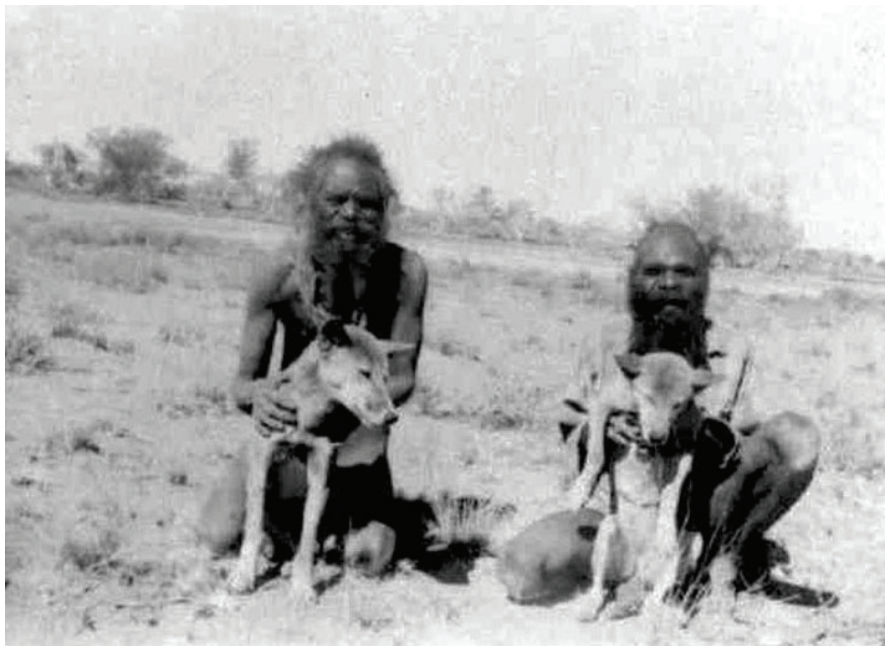
Figure 2 : Deux Aborigènes avec des dingos. Photographie anonyme, prise en juin/juillet 1957 dans les Territoires du Nord, lors de l'expédition du lac Mackay.

ici ajouter, pour commencer, celui de James Dawson (par ailleurs souvent cité par A. Testart), qui écrit à propos des Aborigènes de la région de Melbourne : « Le dingo (...) tient, à juste titre, la première place dans l'estime des Aborigènes. (...) [Les dingos] étaient d'ordinaire élevés à l'état domestique, et on ne se débarrassait jamais des petits. (...) Les chiens étaient entraînés à garder les wuums [campements], ce qu'ils faisaient en grognant et en hurlant. (...) On les dressait également pour la chasse ; c'était là leur principal usage. Ils s'employaient habilement à tuer