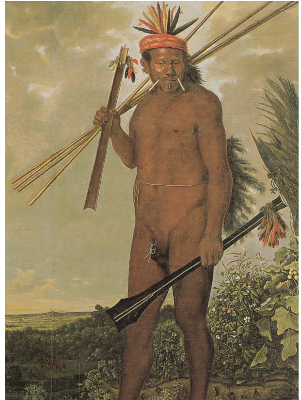
Figure 4 : « Un Indien tarairu ». Peinture d'Albert Eckhout (1641).

En ce qui concerne le détroit de Torrès, malgré les inévitables lacunes de la documentation, on dispose de suffisamment d'éléments pour ne pas être condamné aux suppositions a priori. C'est d'autant plus nécessaire que la région présente tous les dehors d'un apparent paradoxe. En effet, non seule-