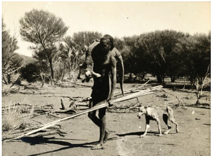
Figure 9 : Aborigène de retour de la chasse. Photographie de Charles P. Mountford (1840), Mont Conner, Northern Territory.

Ainsi, même si les coutumes matrimoniales possédaient la généralité et la rigueur que leur prête A. Testart, elles n'entraîneraient pas nécessairement l'indifférence à la production matérielle que celui-ci pensait avoir mise en évidence. Mais il y a plus : même si elle s'appuie sur de nombreuses observa-