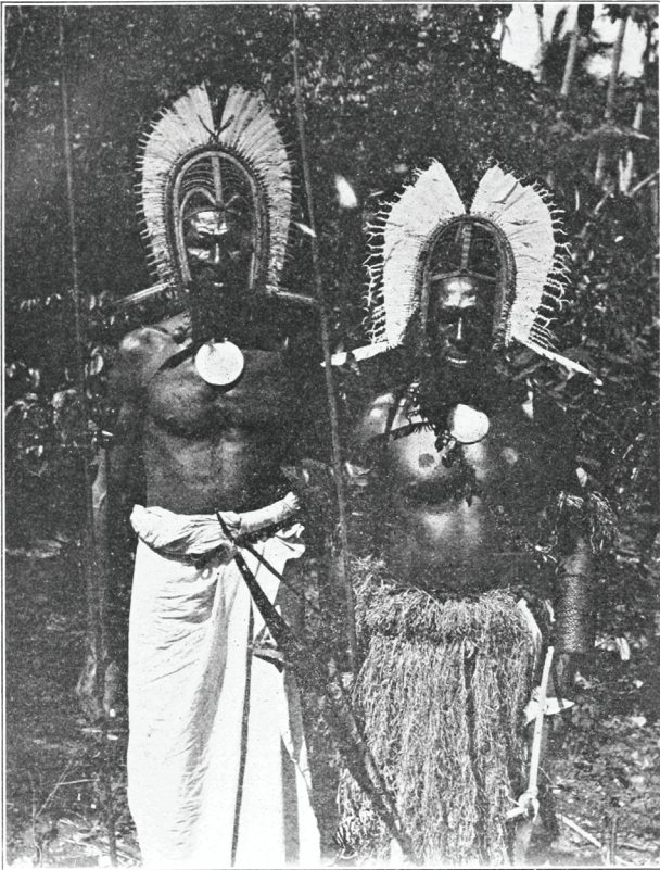
Figure 6 : Habitants de l'île de Mer (Murray). Photographie anonyme, 1914.

plus redoutable. On m'a expliqué qu'il fallait généralement trois ou quatre flèches pour mettre un adversaire hors de combat, tandis qu'une seule lance suffisait d'ordinaire à produire l'effet recherché ; par ailleurs, on vise mieux qu'avec l'arc et les flèches. Toujours à Muralug, j'ai entendu que pour combattre les Blancs, les lances étaient plus efficaces que les flèches. (...) On trouve [les propulseurs] dans les îles les plus occidentales, de Muralug à Mabuig, mais je ne crois pas que leur usage s'étende au nord jusqu'à Dauan, Saibai et Boigu, ou à l'est jusqu'à Tud et Nagir » (Haddon 1890 : 331-332).