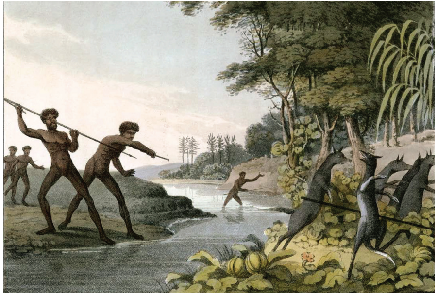
Figure 1 : « Chasse au Kangourou à la lance et au propulseur, Nouvelle-Galles du Sud ». Aquarelle d'Edward Orme (1814).

La question des rapports entre progrès technique et formes sociales est sans doute l'une des plus difficiles, mais aussi des plus stimulantes, de l'étude des sociétés. En ce qui concerne plus particulièrement les chasseurs-cueilleurs, Alain Testart est un des seuls anthropologues du xx e siècle à avoir formulé une thèse explicite de portée transculturelle. Selon lui, le progrès technique s'est accompli parmi ces peuples à un rythme très inégal, qui ne peut s'expliquer par les seules différences de conditions environnementales : il tient avant tout aux structures sociales, qui peuvent être regroupées en deux grands types exerçant des effets opposés sur l'innovation technique (Testart 1985, 2012). Cette explication est censée éclairer en particulier le retard que présenterait l'Australie aborigène sur les autres régions du globe. A. Testart souligne ainsi que, bien que les tribus australiennes du cap York aient été en contact avec les populations mélanésiennes du détroit de Torrès, plusieurs innovations majeures ne se diffusèrent pas des secondes vers les premières. Il accordait une importance particulière à l'absence, en Australie, de ces quatre éléments que sont l'arc, le chien, le fumage du gibier et l'agriculture. (fig. 1) A. Testart renouvelait ainsi l'idée, plusieurs fois avancée, d'un authentique blocage – un « verrou » (Cresswell, 1996 : 83) – du progrès technique par l'Australie aborigène, blocage qui avait pu être notamment attribué à