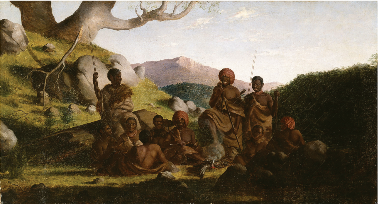
Figure 3 : « Aborigènes de Tasmanie ». Peinture de Robert Dowling (1856).

« L'absence de l'arc en Australie ne revêt toute son importance théorique que lorsqu'on cesse d'y voir une simple curiosité ethnographique pour l'envisa-