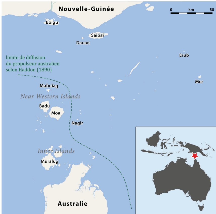
Figure 5 : Le détroit de Torrès et la diffusion du propulseur.

les lances australiennes n'avaient pas seulement pris la place des lances locales. Elles y avaient remplacé les arcs, pour la raison la plus simple qui soit : on les considérait comme plus efficaces.