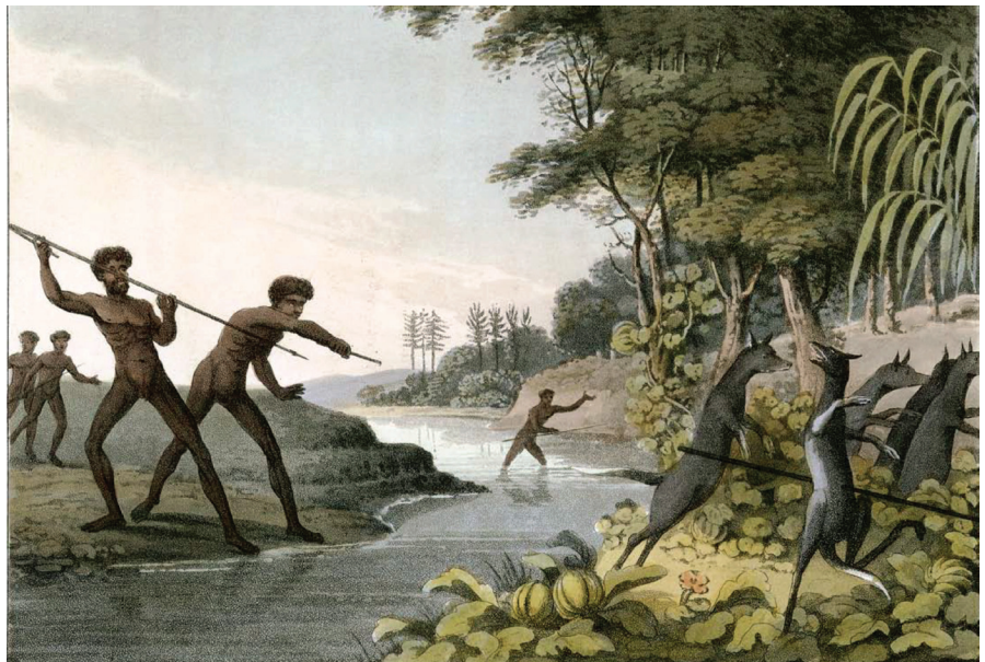
Figure 1 : « Chasse au Kangourou à la lance et au propulseur, Nouvelle-Galles du Sud ». Aquarelle d'Edward Orme (1814).

blocage d'ordre culturel du progrès technique par l'Australie aborigène, blocage qui avait pu être notamment attribué à des valeurs religieuses conservatrices 1 .