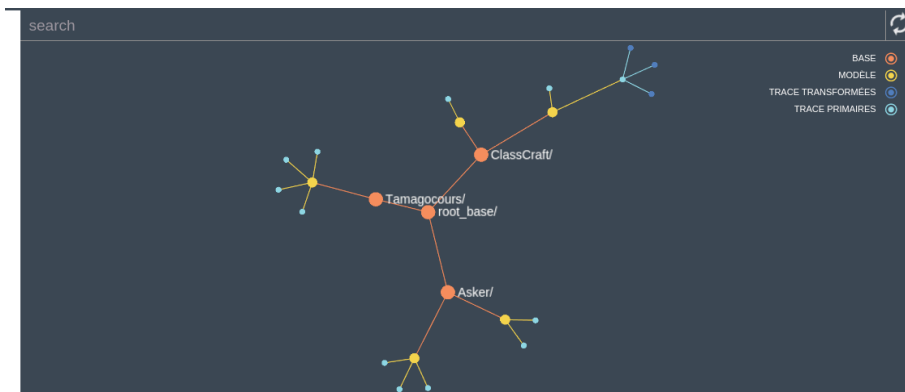
Figure 2. Capture d'écran d'un composant de la plateforme KTBS4LA destiné à la gestion des différents éléments stockés dans kTBS.

L'analyste va pouvoir organiser son système à base de traces en créant des bases kTBS, notamment à l'aide d'une visualisation sous forme de graphe (cf. figure 2 : en rouge les bases de traces, en jaunes les modèles de traces, en bleu les traces). Dans l'exemple de la figure 2, on voit par exemple une base de traces pour chaque EIAH.