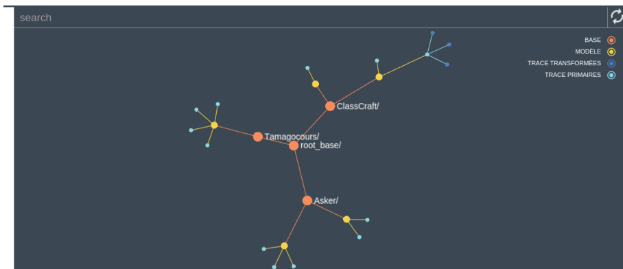
Figure 2. Capture d'écran d'un composant de la plateforme KTBS4LA destiné à la gestion des différents éléments stockés dans kTBS.

L'analyste va pouvoir organiser son système à base de traces en créant des bases kTBS, notamment à l'aide d'une visualisation sous forme de graphe (cf. figure 2 : en rouge les bases de traces, en jaunes les modèles de traces, en bleu les traces). Dans l'exemple de la figure 2, on voit par exemple une base de traces pour chaque EIAH.