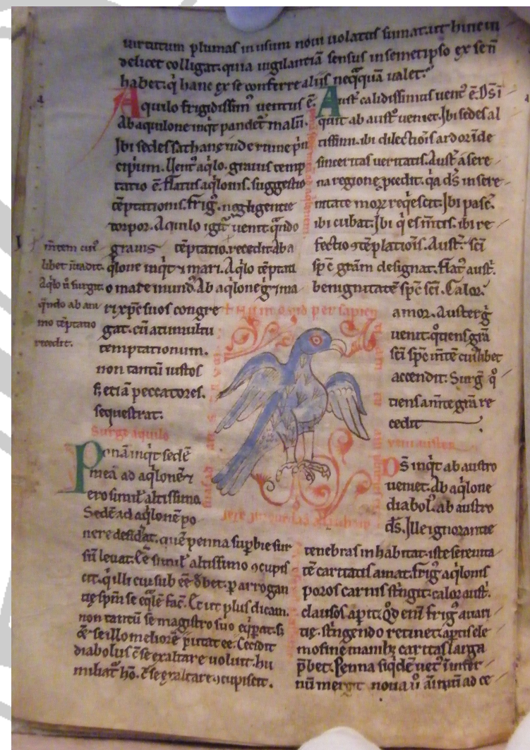
Vendôme, BM, ms. 156, f. 5 et 9v.