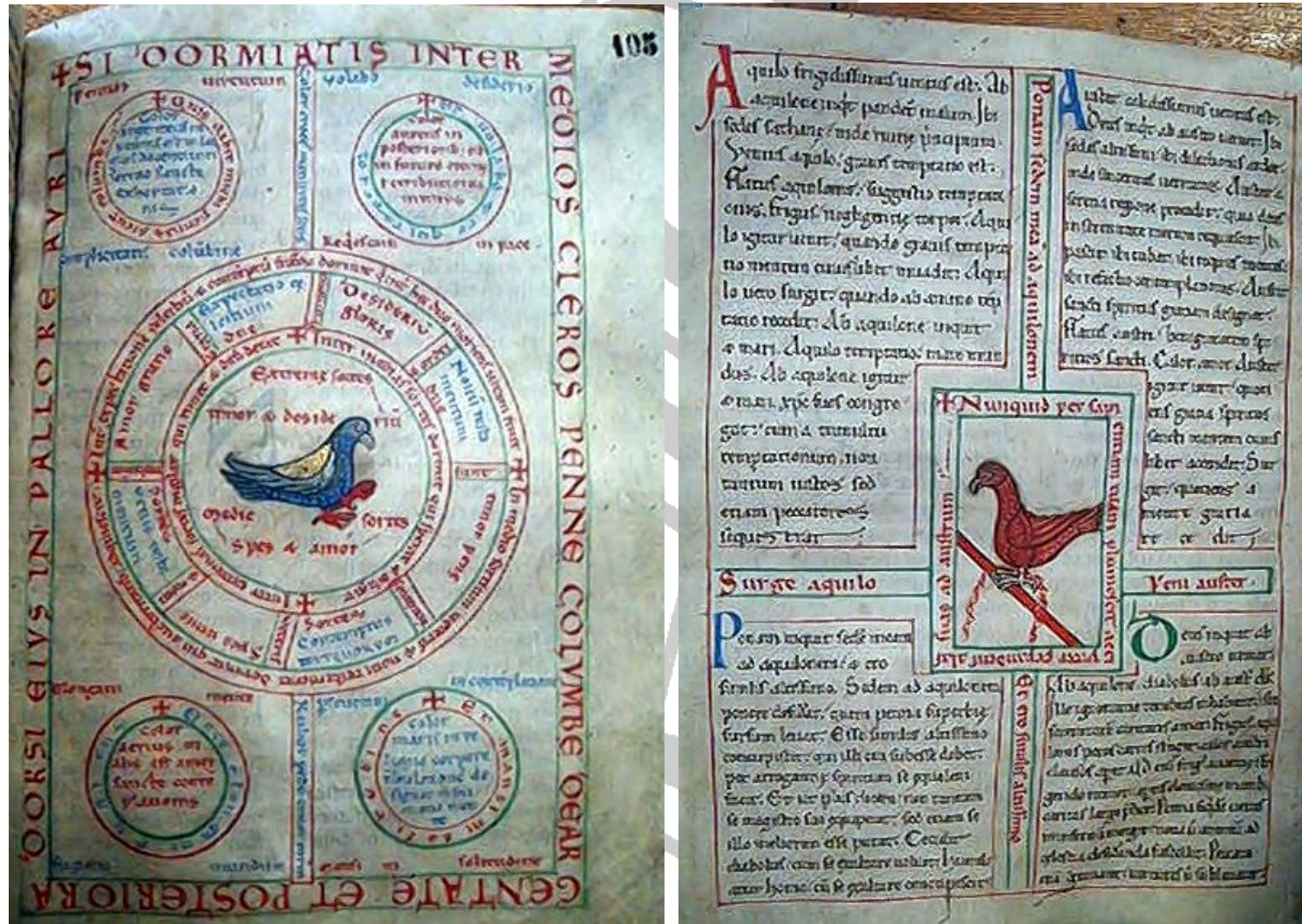
Douai, BM, ms. 370, f. 105-105bisv.