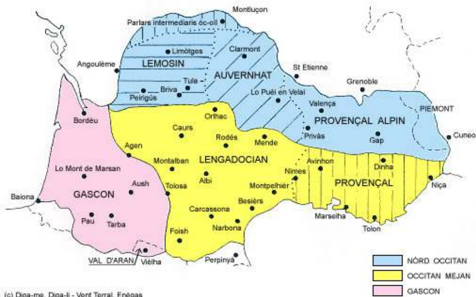
Figure – La langue occitane 18

24 L'ensemble occitan se caractérise quant à lui par des traits morphologiques et phonologiques restés plus proches des origines latines. La langue occitane est dialectalisée. Les linguistes s'accordent habituellement à reconnaître six grands ensembles dialectaux : limousin, auvergnat, vivaro-alpin, provençal, languedocien et gascon. La carte présentée ci-dessous est annotée en occitan.