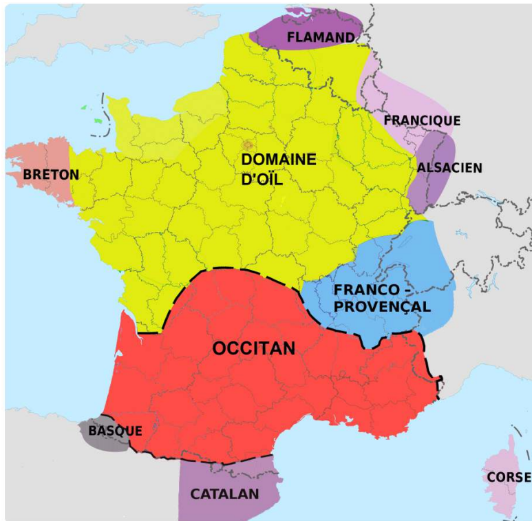
Figure – Langues de France et bipartition du domaine gallo-roman 16

dialectale somme toute modérée du domaine, et de l'Histoire de cette langue qui a notamment été la première langue romane à avoir connu une littérature d'envergure européenne à travers la poésie lyrique des Troubadours. Le domaine d'oïl est, quant à lui, reconnu aujourd'hui, en général, comme relativement moins homogène que celui d'oc, et l'on parle plus facilement de langues d'oïl au pluriel. La mythologie nationale de la genèse du français continue parfois de faire naître ce dernier de l'ensemble des dialectes d'oc et d'oïl 15 quand pourtant il est avant tout morphologiquement et phonologiquement un avatar d'oïl, ce qui ne l'empêche pas d'avoir emprunté à d'autres domaines bien évidemment.