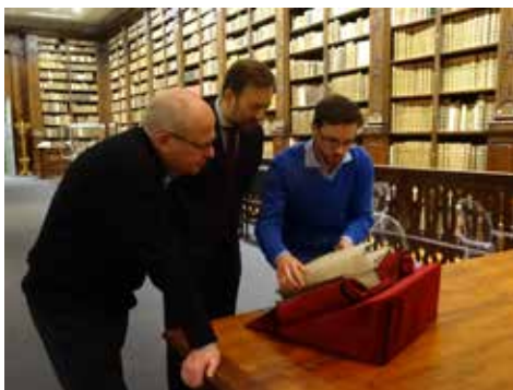
Présentation du First Folio de Shakespeare au maire et au directeur des affaires culturelles © BAPSO - DR.

Cet effort a porté ses fruits : nous avons dépassé les 7 000 visiteurs durant les trois mois d'été 2015 13 . Un grand nombre d'Audomarois ont également fait à nouveau connaissance avec la salle patrimoniale de la bibliothèque, mais aussi avec l'établissement dans son ensemble. En effet, le nombre d'inscriptions à la bibliothèque a sensiblement augmenté après l'événement. Nous avons également suscité l'intérêt pour nos collections auprès des universitaires 14 .