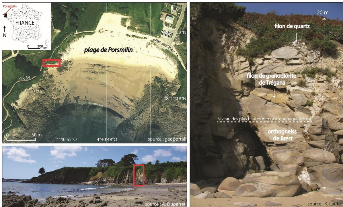
Figure 1 : Localisation de la falaise instrumentée à Porsmilin (Plougonvelin, Finistère)

hauteur moyenne de 20 m, sont taillées dans l'orthogneiss de Brest, avec des filons de granodiorite de Trégana et de quartz. Ces falaises rocheuses présentent une certaine susceptibilité au recul en raison : 1) principalement de la forte altération des roches et l'existence de nombreuses failles et diaclases, 2) de la houle, avec une hauteur significative moyenne de 0,5 m montant à 0,8 à 1,5 m lors de périodes de tempête (Dehouck et al., 2009) et pouvant atteindre jusqu'à 4 m dans des conditions météo-marines exceptionnelles. Le recul des falaises, qui se produit par à-coups (chutes de blocs, éboulements/écroulements) menace actuellement des enjeux tels que le très fréquenté GR 34 ( \approx 60\,000 passages par an, d'après le compteur installé à la batterie de Toul Logot par la Communauté de Communes du Pays d'Iroise (CCPI)) (figure 1).