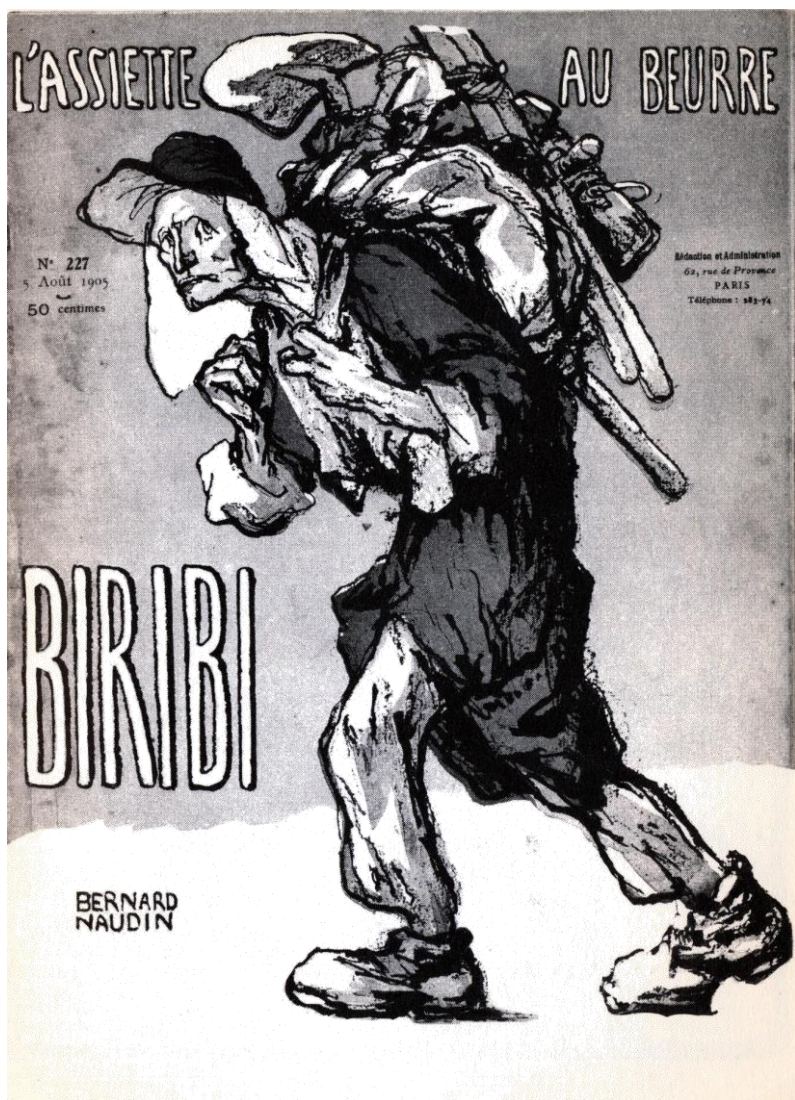
Couverture de l'Assiette au beurre , n°227, août 1905. Illustration réalisée par Bernard Naudin à l'occasion de la sortie de la pièce Biribi © coll. particulière.