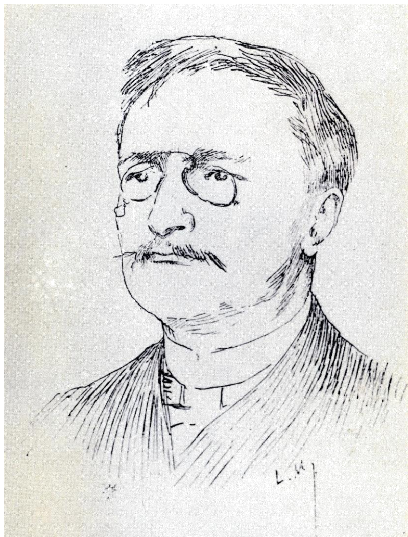
Portrait de Georges Darien par Lucien Mévivet