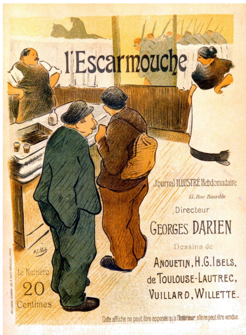
Affiche pour l'Escarmouche (cette illustration figure en couverture du premier numéro de la revue, daté du 12 novembre 1893) © coll. particulière.