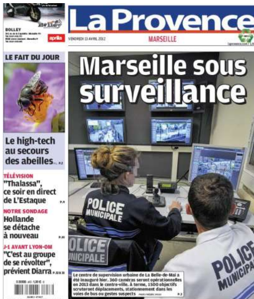
Document : la Une du quotidien régional La Provence, le 13 avril 2012

de la ville au sein de la police municipale. Au moment où nous l'avons étudié, 47 policiers municipaux et 2 techniciens étaient affectés à ce service, lui permettant de fonctionner 7 jours sur 7 et 24 heures sur 24. Un huitième de l'effectif de la police municipale est donc affecté au CSU, ce qui est considérable et inédit en France à notre connaissance. Un tel investissement résulte à la fois de la volonté politique de marquer cet investissement de la ville dans la sécurité, et de la stratégie initiée par le nouveau directeur de la sécurité recruté par la ville, qui est en même temps le directeur du service de police municipale. Le CSU sera de fait ouvert en avril 2012, assorti une intense communication politique de la part de la municipalité. Le quotidien régional La Provence - principal organe de presse local, particulièrement choyé par les élus locaux - en fera sa Une et, anecdote significative, nous avons pu constater au cours de notre enquête que cette Une était encadrée comme un tableau et affichée en bonne place dans le bureau du directeur de la police municipale.