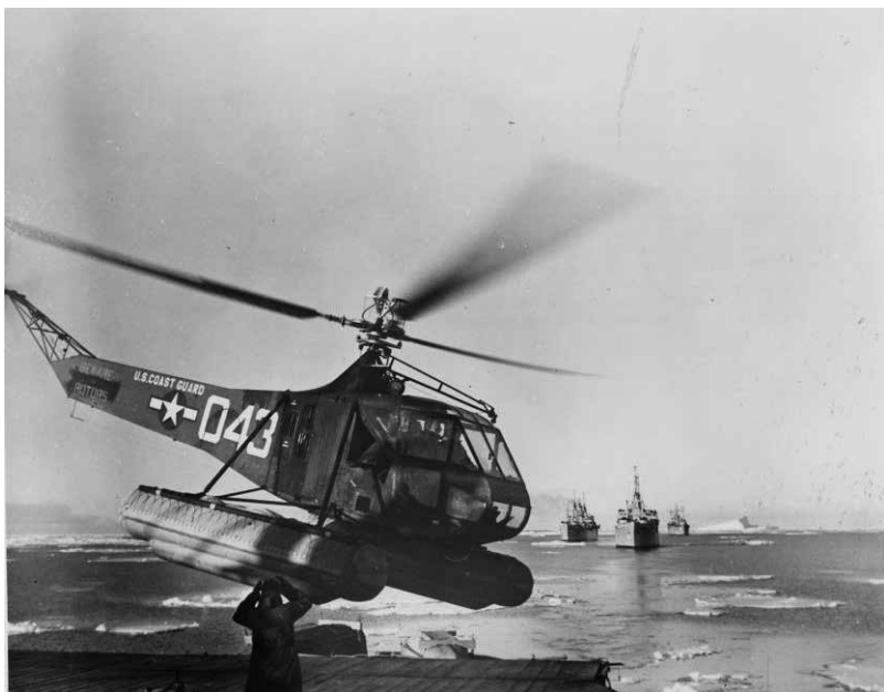
Illustration 3. L'Opération Highjump (1946-47) – impliquant de nombreux bateaux, hélicoptères et avions – a initié l'intervention massive de diverses technologies de transport et de combat en Antarctique