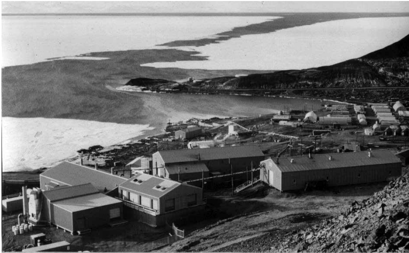
Illustration 1. Le site du premier et seul réacteur nucléaire mobile jamais utilisé en Antarctique : PM-3A à la station McMurdo en 1965, situé un peu en hauteur au-dessus de la base, bien visible en bas à gauche sur l'image