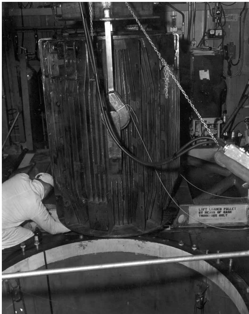
Illustration 2. Le cœur du réacteur nucléaire mobile lors de son installation en Antarctique en 1962