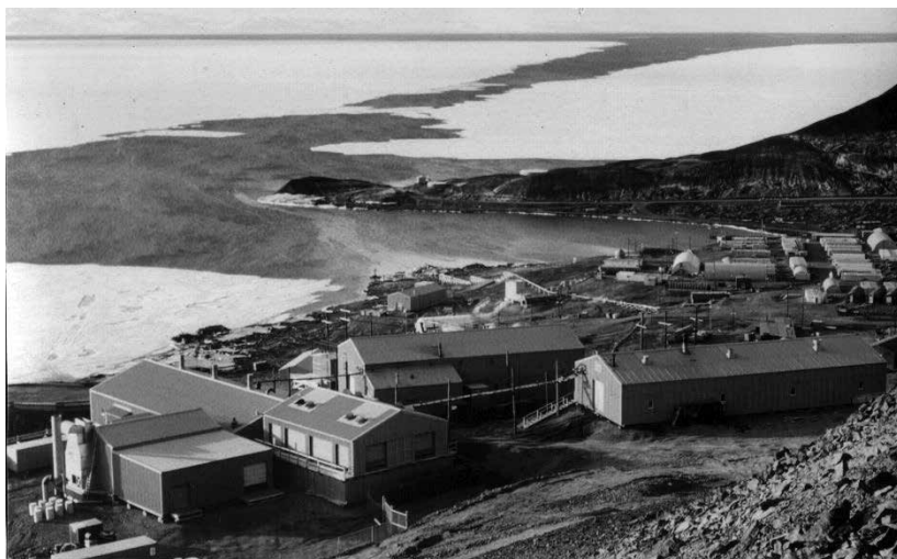
Illustration 1. Le site du premier et seul réacteur nucléaire mobile jamais utilisé en Antarctique : PM-3A à la station McMurdo en 1965, situé un peu en hauteur au-dessus de la base, bien visible en bas à gauche sur l'image