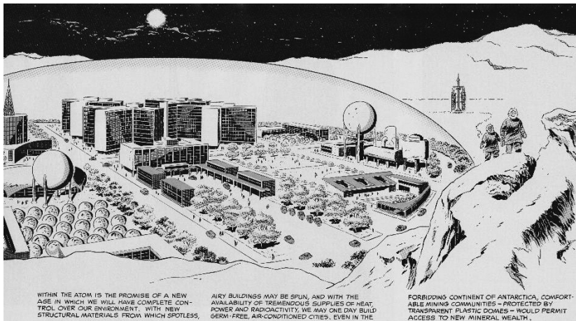
Illustration 4. La bande dessinée The Atomic Revolution de 1957 imaginait la construction d'une ville minière « sous cloche » en Antarctique, entièrement nucléarisée

Quand on considère le contexte culturel et politique plus large aux États-Unis, nombreux sont les exemples qui imaginent un accès facilité aux régions polaires et une colonisation durable de terres auparavant inhabitables, notamment grâce à l'énergie nucléaire et à des dômes protecteurs. En effet, les rêves de Paul Siple concordent pendant les années 1950 et 1960, nous l'avons montré ailleurs, avec un grand nombre de visions futuristes et de projets de mise sous cloche de villes polaires et spatiales. 23 Ceci allait de villes imaginées sur Mars dans la littérature de science-fiction, aux dômes géodésiques de Buckminster Fuller qui abritaient aussi bien des stations radar que des expositions universelles et qui ont par la suite inspiré toute une génération d'architectes, en passant par l'esquisse d'une ville minière en Antarctique (voir figure 4), réalisée dans le cadre d'une campagne de propagande de l'AEC qui accompagnait le programme Atoms for Peace lancé par Eisenhower pour promouvoir l'utilisation civile de l'énergie nucléaire.