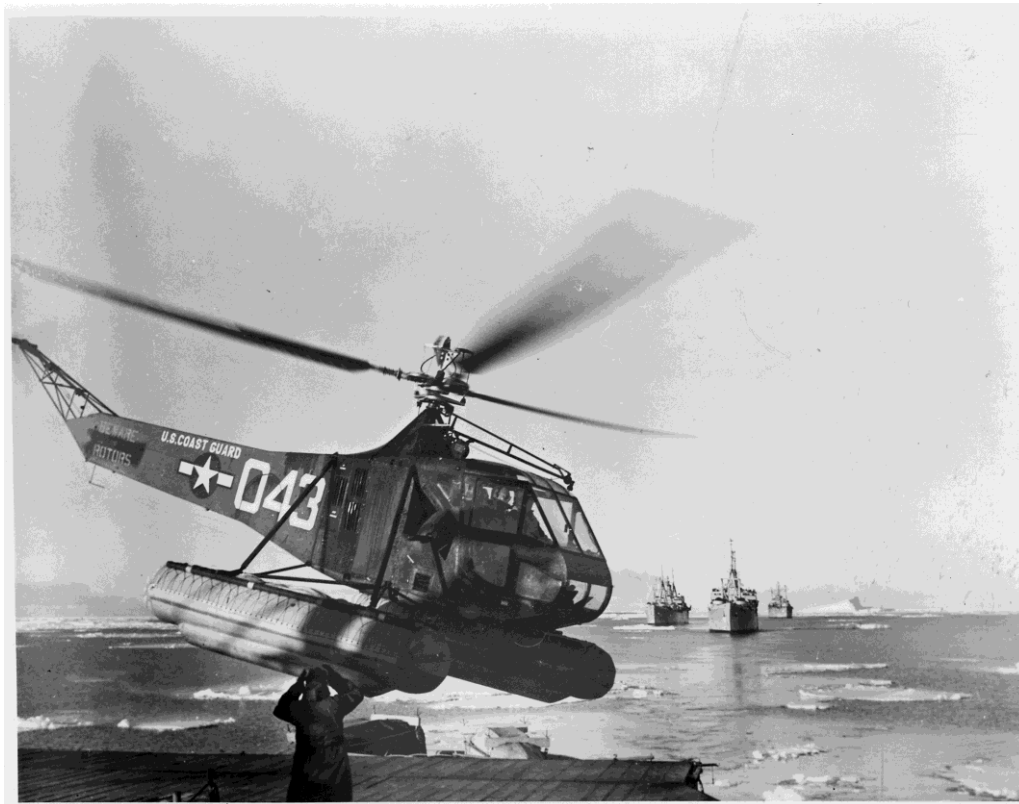
Figure 3 : L'Opération Highjump (1946-47) – impliquant de nombreux bateaux, hélicoptères et avions – a initié l'intervention massive de diverses technologies de transport et de combat en Antarctique.

reste jusqu'à aujourd'hui la plus importante, impliquant près de 4700 militaires, des avions, des hélicoptères et de nombreux bateaux.