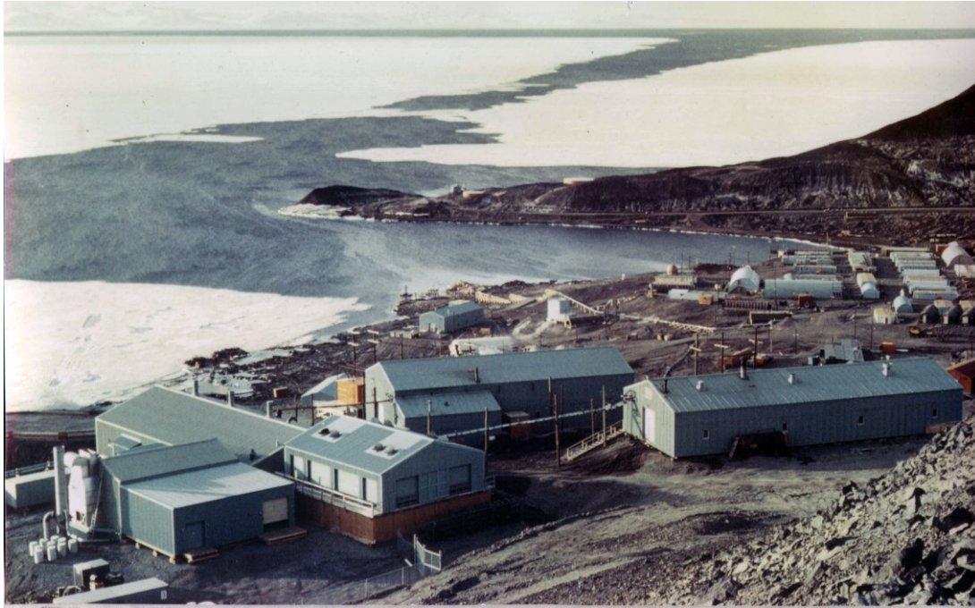
Figure 1 : Le site du premier et seul réacteur nucléaire mobile jamais utilisé en Antarctique : PM-3A à la station McMurdo en 1965, situé un peu en hauteur au-dessus de la base, bien visible en bas à gauche sur l'image.