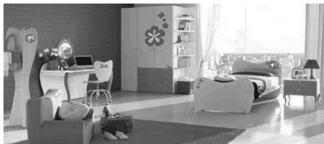
Figure 1. Doimo Cityline – Chambre Barbie