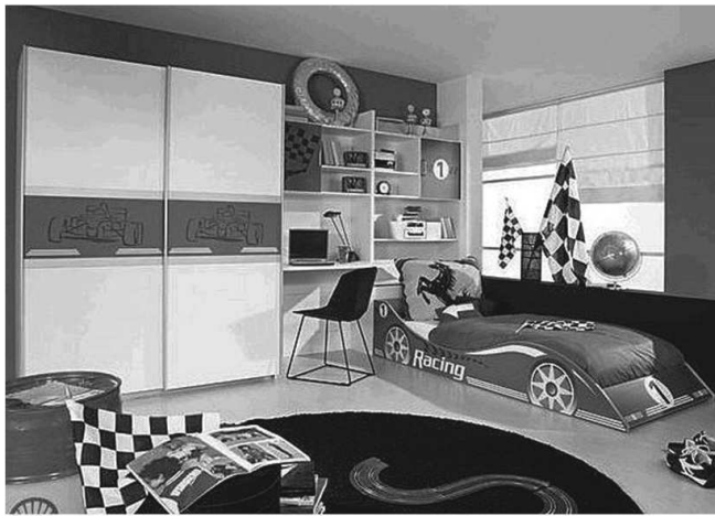
Fig 5. Rauch – Chambre Ferrari Racing