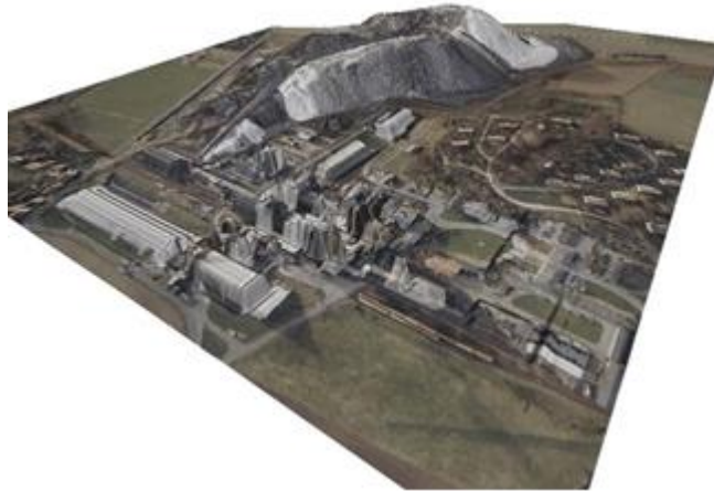
Figure 3: Extrusion des bâtiments à partir d'une orthophotographie, réalisée sous Grass GIS

satellites, de données « raster » (tous les formats d'images existants), de fichiers vectoriels (tous types de formats à l'import et à l'export : « .tab », « .shp »), toutes les analyses statistiques. De plus, il possède un module de visualisation des surfaces en trois dimensions (nommé NVIZ Visionneuse 3D) pouvant générer des MNT (Modèles Numériques de Terrain) en intégrant même le bâti (import des fichiers Autocad « .dxf »...) et d'en exporter une séquence animée.