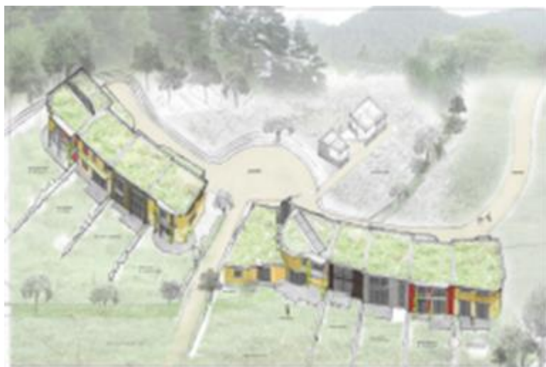
Figure 1: Le projet Écolline, à Saint-Diè-des-Vosges Source : Ascendance Architecture, réalisé sous Sketchup)

Le projet Ecolline illustre la nouvelle tendance, en France, selon laquelle les citoyens développent, en expérimentant une nouvelle façon d'habiter, leur territoire : il s'agit de repenser les pratiques, de partager de nouvelles expériences, de changer les comportements, d'inventer d'autres usages et de réapprendre à vivre ensemble. Ecolline n'est donc pas seulement un projet de construction durable, il s'agit aussi d'une expérience humaine. Issue d'une réflexion et d'une démarche collective, elle repose sur un « projet de vie en harmonie avec les idées de partage, de solidarité, d'échanges, de vie saine, de modifications des comportements de consommation et de respect de l'environnement » (extrait des statuts de l'association Ecolline). La dimension sociale transparait dans l'ensemble des entretiens réalisés : « Pour chacun, il a été question de faire un travail sur soi et vers les autres, trouver un équilibre et faire des compromis pour prendre des décisions à l'unanimité... L'écoute, la remise en question et la communication ouverte et non violente sont les garants de la réussite » (membre de l'association). La cohabitation est pensée et le projet articulé autour des espaces collectifs. Les habitants mutualisent certains espaces, tout comme les commandes de matériaux, les échanges de savoir-faire, et s'entraident dans la construction.