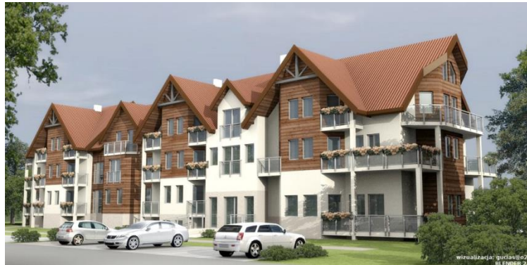
Figure 6 : Rendu final du même projet

Autre outil, plus ergonomique que Blender, Google Sketchup 42 est un logiciel de modélisation 3D essentiel en cartographie et en architecture. Par rapport aux autres logiciels 3D, Sketchup 43 fonctionne selon les principes de l'inférence : il émet des propositions en fonction de ce que l'utilisateur réalise. De plus, à la différence des autres logiciels de modélisation 3D, Sketchup permet de modéliser en temps réel. L'utilisateur travaille directement sur le volume en extrudant 44 ses faces, ajoutant une forme, tant et si bien qu'il devient facile de réaliser ses premiers bâtiments. Le rendu sous Sketchup permet d'obtenir