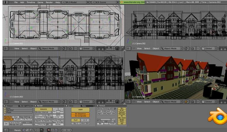
Figure 5 : Exemple d'architecture modélisée à partir du logiciel Blender