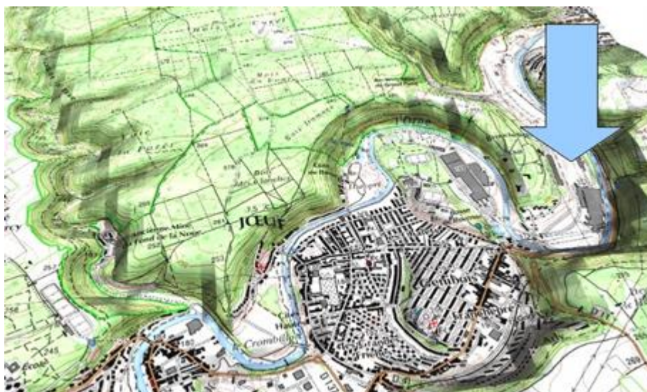
Figure 2 : L'implantation du projet Hermitage, à Joeuf

situation privilégiée sur la commune, puisqu'il représente un attrait paysager indéniable, ouvert sur des éléments emblématiques (collines boisées, châteaux...). Les bords de l'Orne constituent des limites vertes, permettant un accès à un cadre naturel (ripisylves denses, espaces boisés). De plus, cet espace, accessible depuis toute la partie est de la Vallée de l'Orne, est connecté aux autres quartiers et au centre-ville. Le site, bien qu'historiquement industriel et privé, révèle des espaces naturels à préserver, dont l'existence est insoupçonnée des habitants du fait de l'interdiction d'accès au site. Le coût des travaux de viabilisation a été estimé, pour l'ensemble de la zone, à environ dix millions d'euros. Ces travaux comprennent les voiries, les cheminements, l'assainissement, les réseaux divers, l'éclairage public, le mobilier urbain, la signalisation, et l'aménagement d'espaces verts.