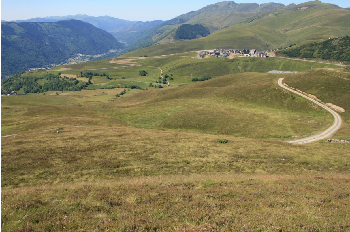
Photo 3 : Aperçu du plateau de Germ où se côtoient les aménagements de la station de Peyragudes (versant Peyresourde) et les surfaces pastorales de l'association foncière pastorale de Germ-Louron et du groupement pastoral de Bassia.