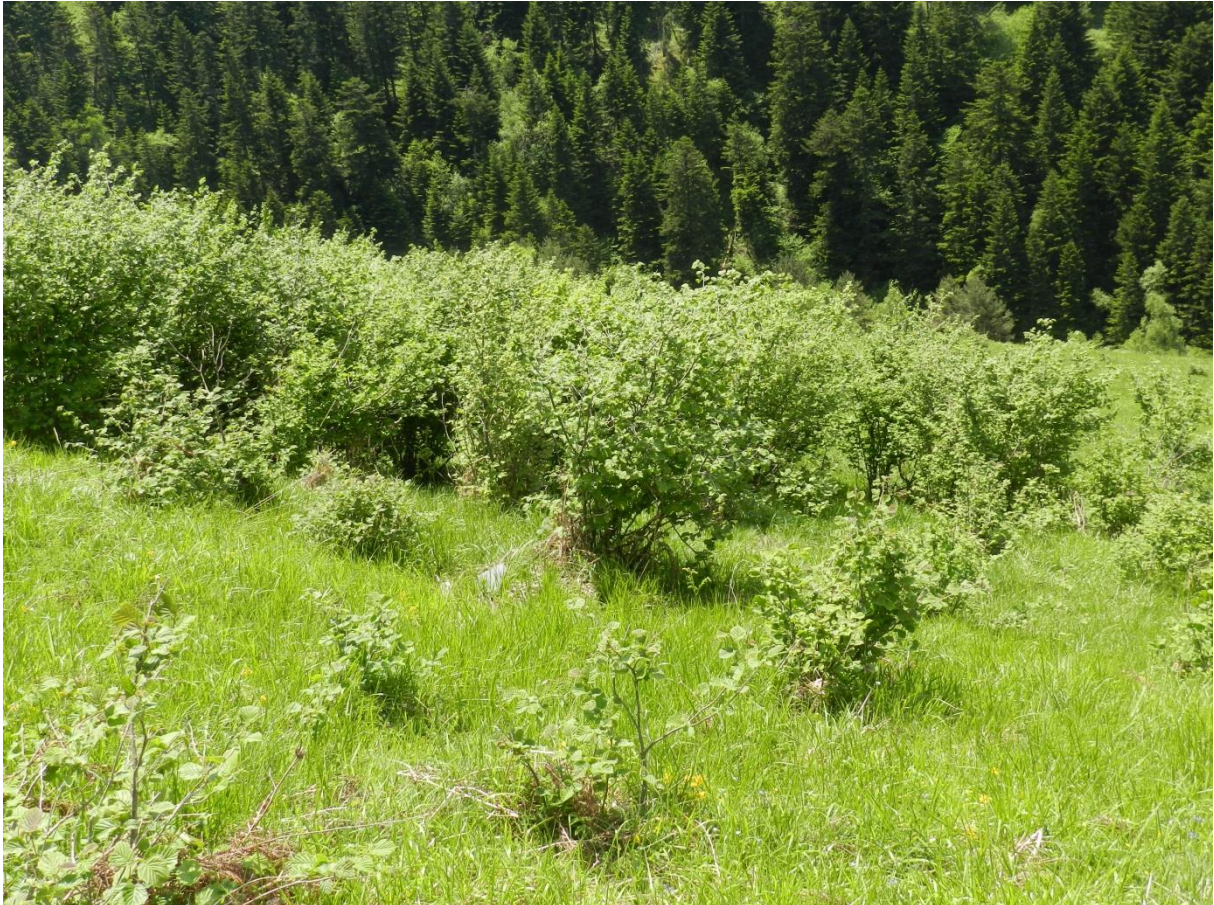
Photo 1 : Avancée du noisetier sur les bas versants de la station de Peyragudes, association foncière pastorale de Germ-Louron.