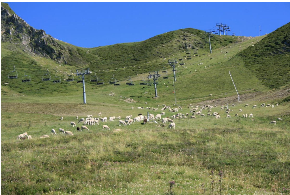
Photo 2 : Troupeau de brebis tarasconnaises pâturent sur la station de Peyragudes.

La montagne qualifiée de « riche » l'est ici au titre de son dynamisme économique. Le pastoralisme apparaît, dans ce deuxième regard porté sur le paysage, à la fois comme acteur (secondaire) de la scène paysagère et facteur de production dans la mise sur le marché d'un paysage attractif construit pour les touristes grâce à l'agencement par les acteurs locaux des ressources territoriales dont ils disposent.