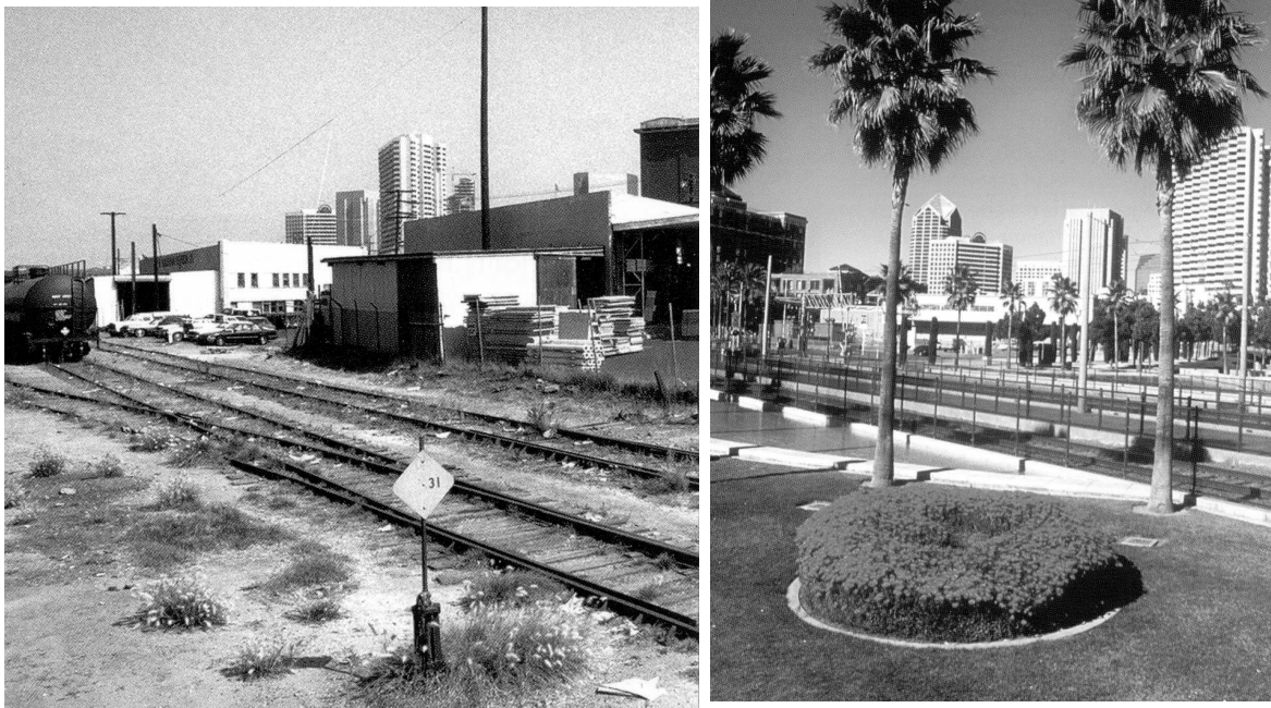
Fig.3 Requalification de la zone d'Harbor Drive (San Diego) entre 1980 et 2002

Selon une enquête menée par l' US Conference of Mayors en 1998, 80 villes de plus de 30 000 habitants possédaient déjà des programmes très aboutis de lutte contre l'insécurité intégrant des dispositions spécifiques dans leur règlement d'urbanisme et schéma directeur (Zelinka et al., 1998). Paradoxalement, en 1999, une enquête menée par l' US Department of Justice statuait qu'aucune étude n'était "aujourd'hui capable de démontrer l'influence directe des changements de morphologie urbaine sur le comportement criminel" (Deleon-Grandos, 1999). La diffusion grandissante des principes du CPTED en Amérique du Nord mais également en Europe 6 (Royaume-Uni, Pays-Bas...) parce qu'ils encouragent une approche pro-active de l'insécurité basée sur la prévention et un mode "doux" de sécurisation, a au moins le mérite d'offrir une alternative à la logique répressive, toujours synonyme d'échec.