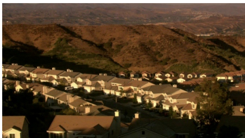
Figure 2 : Une vue du paysage stéréotypé d'Agrestic, lieu de vie des principaux personnages de la série Weeds (il s'agit en réalité de la communauté de Stevenson Ranch située dans le comté de Los Angeles).