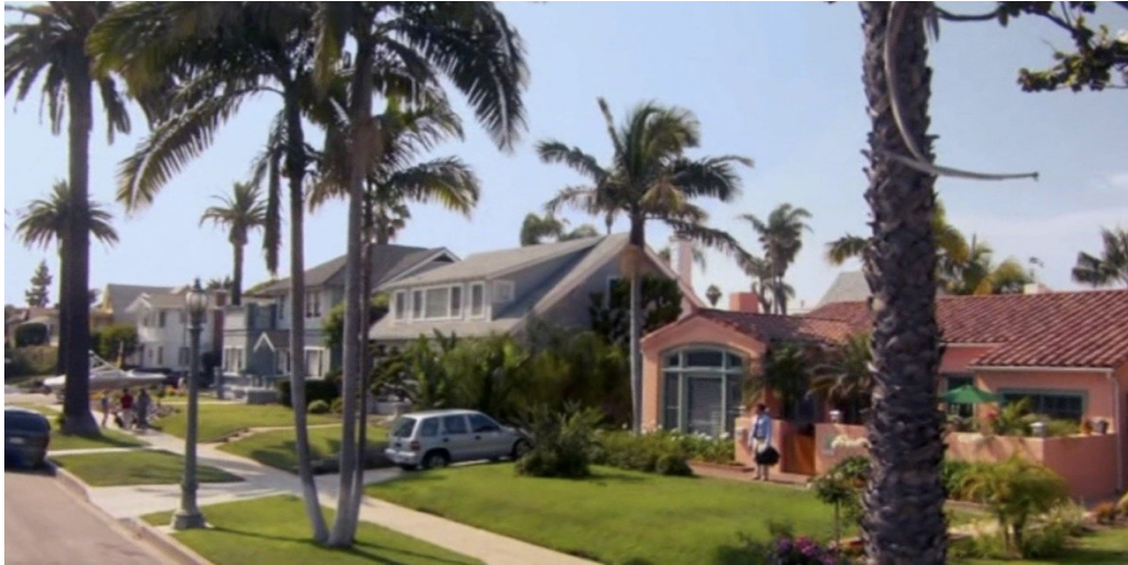
Figure 3 : Dexter Morgan dans son nouvel environnement résidentiel : Living the Dream (saison 4, épisode 1).