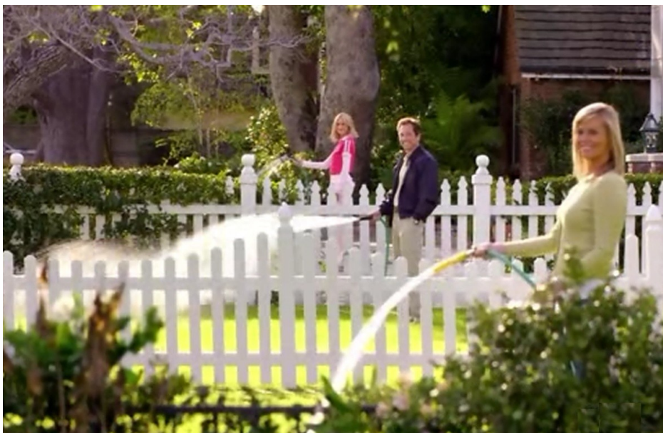
Figure 4 : Scène du pilote de la sitcom Suburgatory .

Au-delà des sarcasmes qu'elle suscite, les suburbs deviendraient également un terrain propice à la multiplication de comportements déviants. Bon nombre de personnages ne semblent, en effet, pas avoir d'autre issue pour vivre que de se transformer en anti-héros, prêts à s'adonner à quantité d'actes que la morale ordinaire réproouve : le mensonge compulsif, l'adultère, les pratiques addictives en tous genres (alcoolisme, consommation de marijuana). Le basculement dans la violence et les crimes les plus graves constituent un autre de leurs traits caractéristiques (trafic de drogues ou d'armes, meurtres accidentels ou prémédités). La fascination exercée par des personnages aussi troubles ou terrifiants que Dexter Morgan ( Dexter ), Walter White ( Breaking Bad ), Tony Soprano ( The Sopranos ), Jax Teller ( Sons of Anarchy ), Nancy Botwin ( Weeds ) ou Don Draper ( Mad Men ) découle, dans une large mesure, de leur capacité à échapper à la monotonie de la condition suburbaine (Figure 4). Ils n'en sont pas moins des êtres monstrueux, égarés et névrosés, incapables de parvenir à une quelconque forme de sérénité morale ou affective.