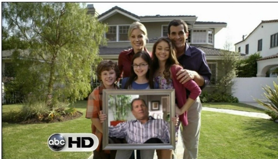
Figure 5 : La maison de la famille Dunphy ( Modern Family ), située dans une banlieue de Los Angeles.