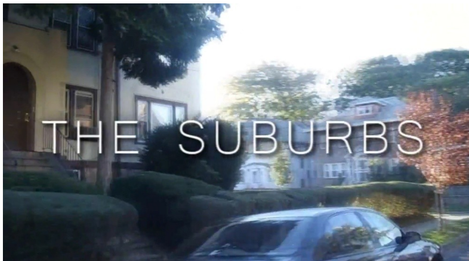
Figure 6 : Un plan du générique de début de The Suburbs .