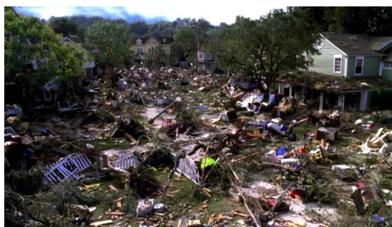
Fig. 1 : La banlieue résidentielle, un mythe qui s'effondre ? ( Desperate Housewives , 4.9)