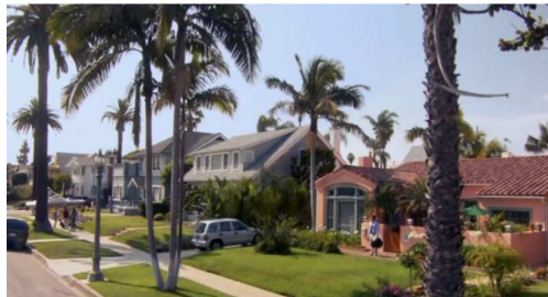
Fig. 2 : La suburb , lieu de la normalisation sociale ( Dexter , 4.1)

Étonnamment, c'est dans une série mettant en scène un tueur en série ( Dexter , Showtime, 2006-), découpant minutieusement ses victimes avant de les jeter dans la mer des Sargasses, au large de Miami, que surgissent les principaux questionnements structurant la vision contemporaine de la banlieue américaine. En effet, dans les premiers épisodes de la Saison 4 (épisodes 1, 5 et 6), Dexter Morgan, expert médico-légal dans la police de Miami le jour et justicier sanguinaire la nuit, quitte, à la suite de son mariage, son appartement de Biscayne Bay pour emménager dans une banlieue pavillonnaire de Miami (voir figure 2). Ce prédateur solitaire, devenu mari, père et beau-père de trois enfants, se fonde ainsi tant bien que mal dans la tanière improbable que représente pour lui la banlieue résidentielle. Cependant, rendu mal à l'aise par des relations de voisinage qu'il vit sur le mode de l'oppression, Dexter est petit à petit amené à porter un autre regard sur cet idéal socio-résidentiel et à en discerner la dimension cachée. Il découvre ainsi qu'un autre tueur en série, Trinity, aussi actif que lui, se camoufle derrière l'image d'un brave père de famille middle-class , retrouvant la chaleur du foyer pavillonnaire après chaque journée de travail ou assassinat barbare.