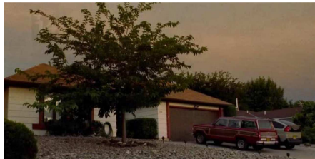
Fig. 7 : Maison de Walter White, dans la suburb d'Albuquerque ( Breaking Bad )

financier, le petit professeur de chimie suburbain prend peu à peu goût au métier, décidant d'investir activement le milieu de la méthamphétamine pour payer sa chimiothérapie et laisser à sa famille de quoi subsister après sa mort. Alors qu'il a accumulé suffisamment d'argent pour reprendre une vie normale, Walt poursuit cependant ses activités, goûtant l'exaltation que suscite l'expérience du danger, sans pour autant abandonner les éléments qui symbolisent la banalité de sa vie antérieure, en particulier son pavillon et son emblématique Pontiac Aztek (voir figure 7). Le pouvoir et la désinhibition découverts par le biais de ses occupations illégales s'avèrent alors être des drogues aussi dures et addictives que celles qu'il fabrique, le conduisant à une fuite en avant souvent plus inquiétante que la maladie qui se développe en lui.