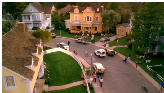
Fig. 3 : Wisteria Lane ou l'illusion du bonheur domestique ( Desperate Housewives , première image du pilote)

Parmi les séries les plus emblématiques et les plus populaires des années 2000, Desperate Housewives (ABC, 2004-2012) est sans doute celle qui a dépeint la suburb avec le plus de systématisme. Dès les premières images du pilote (voir figure 3), les téléspectateurs sont plongés dans une scène contradictoire, annonçant l'ambivalence du regard qui sera porté sur la suburb par la suite. On y découvre en effet un paysage familier, celui d'une suburb nord-américaine qui rassemble tous les éléments caractéristiques du cadre résidentiel auquel n'importe quelle famille des classes moyennes serait censée aspirer. On y voit ainsi des maisons cossues et pimpantes, alignées le long d'une ruelle courbe, à la forme naturelle. Les jardins sont soigneusement ornements de glycine. Les haies et les parterres de pelouse sont fraîchement entretenus tandis que les piétons et les véhicules évoluent harmonieusement au rythme tranquille d'une mélodie