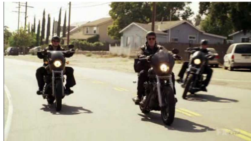
Fig. 10 : Charming ou le règne des nouveaux seigneurs de la guerre ( Sons of Anarchy , pilote)

comme une société libérale, composée de petits propriétaires terriens, organisés sous la forme d'une démocratie directe. Face à une concentration urbaine dénoncée comme aliénante, la suburb apparaît, à partir des années 1850, de plus en plus comme un remède susceptible de réconcilier la ville moderne et la campagne rêvée, permettant de développer un contact personnel avec la nature, de nouer des relations sociales propices à la vie de famille mais aussi à l'exercice d'une vie libre, insérée dans le cadre de petites communautés coopératives et démocratiques. Depuis une cinquantaine d'années, cette appréciation positive de la banlieue semble s'être inversée, le rêve d'une ville-campagne capable de refonder la communauté démocratique n'ayant semble-t-il pas tenu toutes ses promesses 6 . Les séries télévisées contemporaines reprennent ce discours critique pour montrer le caractère partiellement illusoire du mythe de la suburb , parfois sur le ton de la dérision comme dans Desperate Housewives ou Weeds , où les élections s'apparentent par exemple à des farces plutôt qu'à un fonctionnement authentiquement démocratique, parfois de façon beaucoup plus sérieuse et dramatique, réactivant la hantise éminemment politique de la sécession sociale 7 . À ce titre, la série Sons Of Anarchy (FX, 2008-) offre une illustration significative.