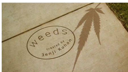
Fig. 6 : Nancy, la plante par qui le mal arrive ( Weeds , image extraite du générique)

And the people in the houses All went to the university Where they were put in boxes And they came out all the same. And there's doctors and lawyers And business executives And they are all made out of ticky tacky And they all look just the same.