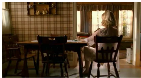
Fig. 8 : Betty « Bovary » Draper ( Mad Men , 1.10)

Outre la domination propre aux rapports de genres, la suburb peut également être associée à l'oppression née de la promiscuité résidentielle et de la pression conformiste exercée par le voisinage, transformant toute originalité personnelle en déviance