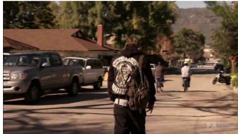
Fig. 11 : Jax Teller, prince de la suburb malgré lui ( Sons of Anarchy , pilote)

fondateurs de la confrérie fictive des Sons of Anarchy , créée par des vétérans de la guerre du Viêt Nam, a dévié progressivement en une société clanique et autocratique, dominée par de véritables seigneurs de guerre dont la principale occupation se résume à la pratique du crime organisé. Le mythe politique originel de la libre association s'est donc transformé peu à peu en un véritable cauchemar, à l'intérieur duquel les héros, tel Jax Teller, semblent pris au piège (voir figure 11).