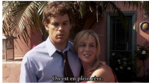
Fig. 9 : Dexter Morgan ou la conquête impossible de la banalité ( Dexter , 4.5)

insupportable pour la collectivité. La quatrième saison de Dexter expose les failles du localisme communautaire propre aux suburbs , notamment dans l'épisode « Blinded by the Light » (4.3), lorsque Dexter tente de s'intégrer au quartier alors menacé par un mystérieux vandale – d'autant que le vandale en question n'est autre que l'un des membres de cette communauté, pris de folie alors qu'il est sur le point d'en être exclu pour des raisons financières. « Ce voisinage va finir par me tuer », déclare Dexter, soulignant ainsi le danger que la communauté représente pour l'individu (voir figure 9). Dès lors, c'est bien l'idéal communautaire qui est interrogé et, dans certains cas, explicitement dénoncé.