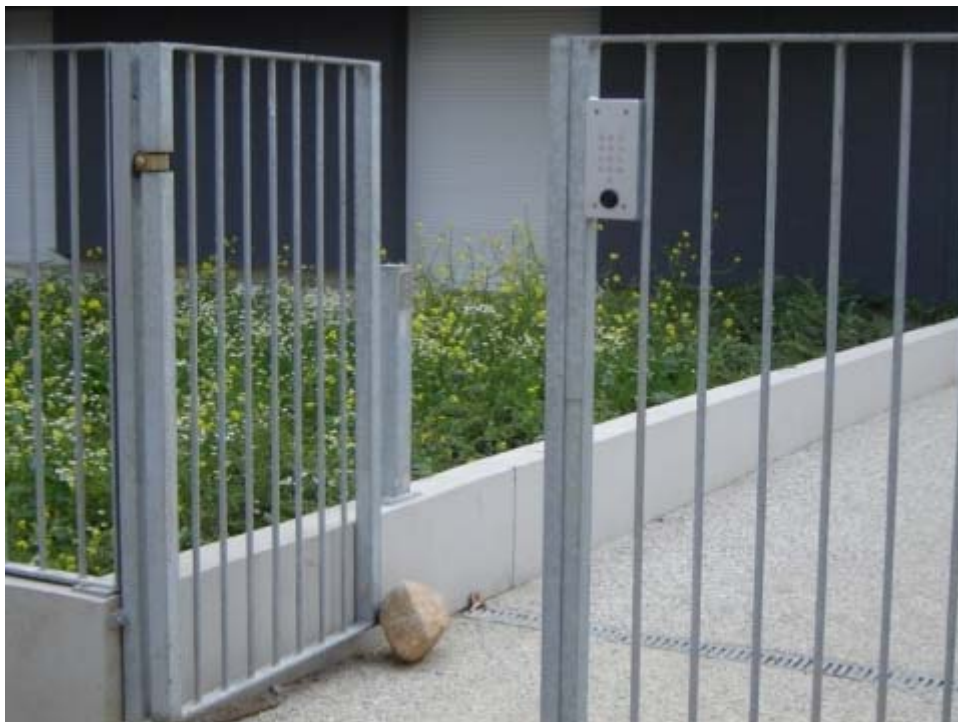
Figure 4: La résidence du prieuré Saint Julien à Rouen : portillon piéton laissé ouvert par une pierre