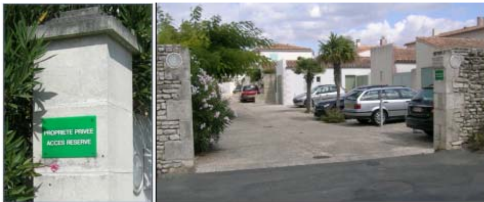
Figure 2 : Le Cours des Tilleuls à Saint-Martin-de-Ré

à l'emplacement des places de parkings, interdisant de facto tout stationnement non autorisé (figure 2).