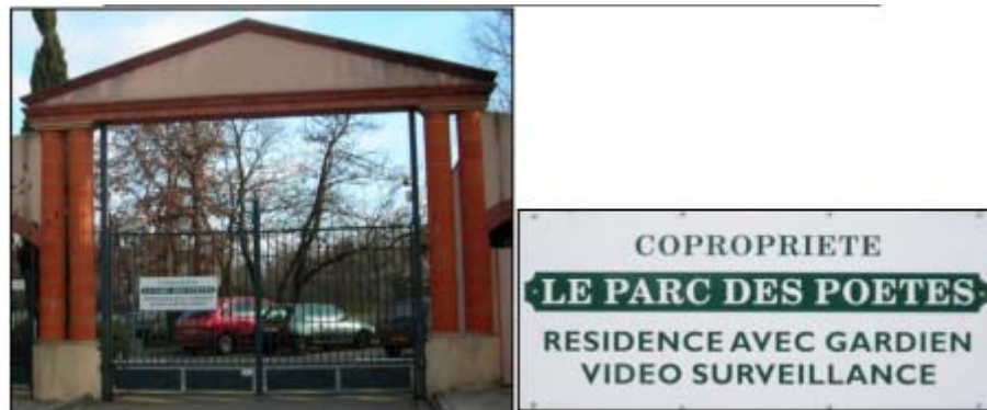
Figure 11 : Le Parc des Poètes à Toulouse : gardien et vidéosurveillance