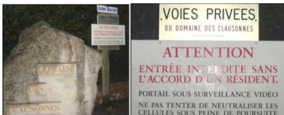
Figure 9 : Le Domaine des Clausonnes à Sophia Antipolis sur la Côte d'Azur : vidéosurveillance