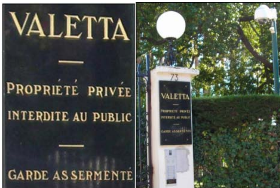
Figure 8 : La résidence Valetta à Cannes sur la Côte d'Azur : garde assermenté et vidéosurveillance