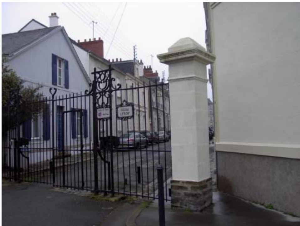
Figure 7 : Le Passage Leroy à Nantes : l'accès aux voitures est fermé par un portail majestueux. Toutefois, celui-ci laisse place (par obligation légale) au passage des cycles et des piétons sur le côté