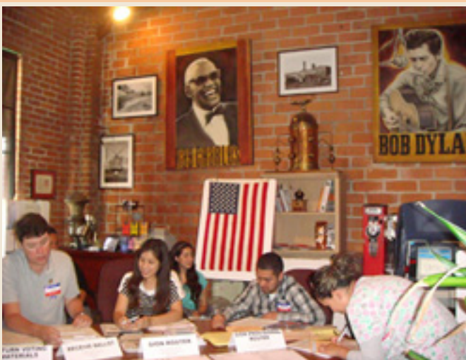
5. Ryan Brothers Coffee, San Diego