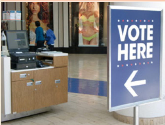
4. Centre commercial Plaza Bonita, National City