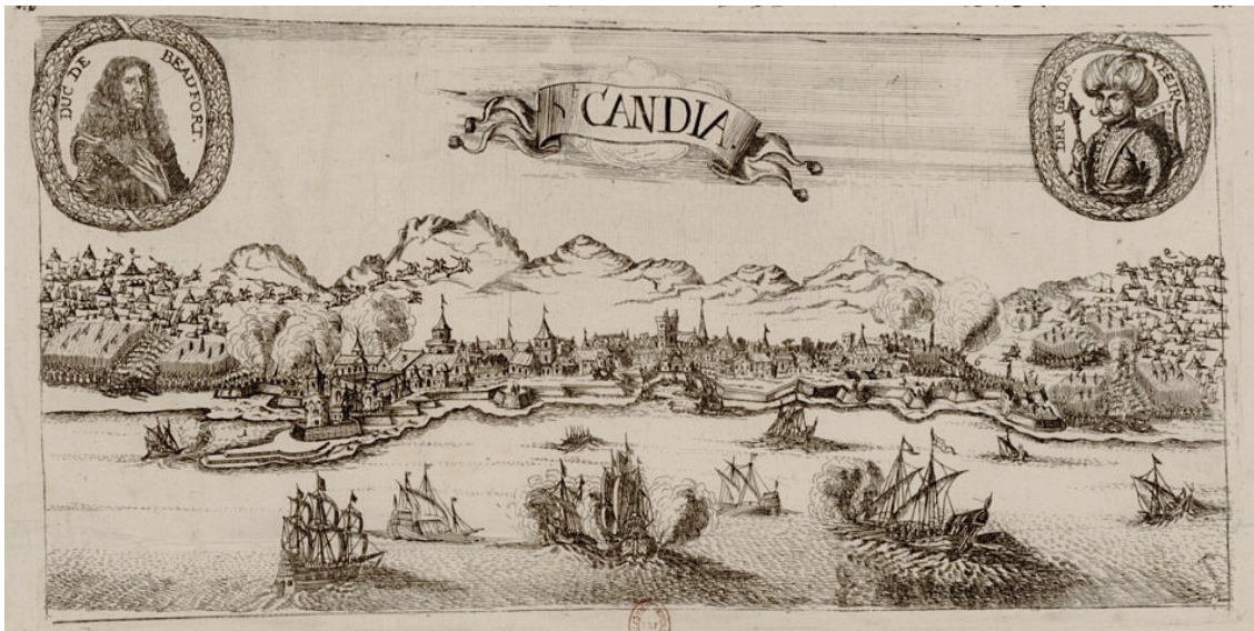
5. Le siège de Candie par le duc de Beaufort en 1669 21

Turcs qu'il trouva la mort, au siège de Candie (Crête actuelle), en juin 1669. Son corps ne fut pas retrouvé et l'émotion fut grande à la cour après sa disparition 20 .