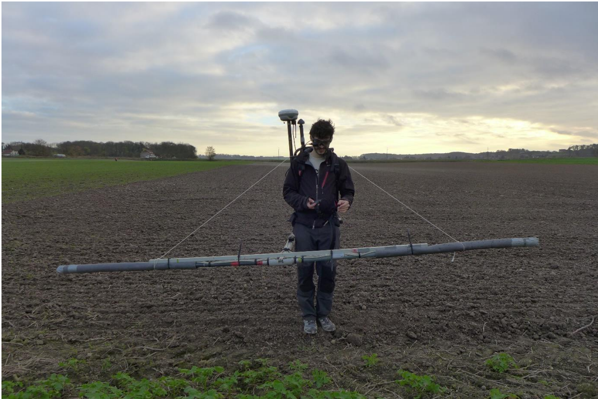
Figure 2 : Dispositif de mesure huit capteurs développé par l'IPGS et monté sur un sac à dos

L'antenne GNSS peut être utilisée seule ou en combinaison avec une base (mode différentiel) pour obtenir une meilleure précision, de l'ordre de quelques centimètres.