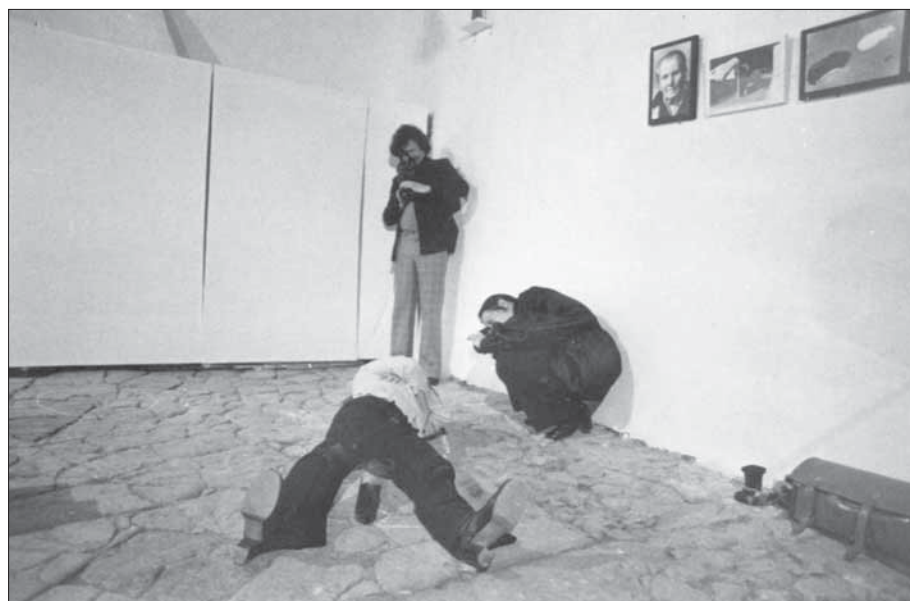
Ill. 1. Gina Pane, Transfert , 19 avril 1973.