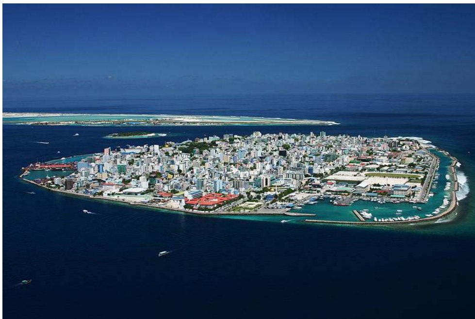
Photographie 1. Malé, la capitale des Maldives, 110 000 habitants

voir dans quelle mesure leurs stratégies d'adaptation et leurs « trajectoires » pourraient devenir des expériences partagées (chapitre 7).