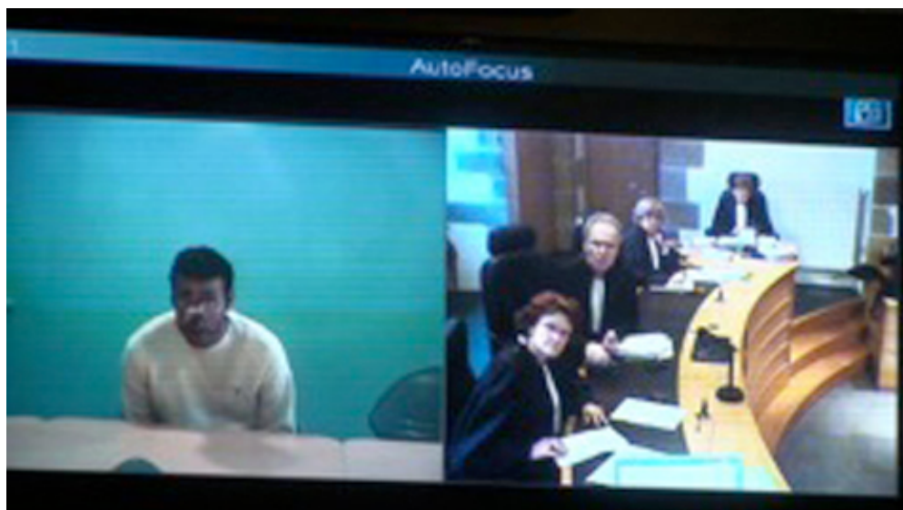
Le président salue le prévenu qui se penche vers le micro pour saluer à son tour.

Après l'avoir salué, le président utilise la télécommande pour diriger la caméra (Cam) vers l'avocat et le montrer l'écran. Alors qu'il ajuste l'angle de vue sur l'avocat, il émet un certain nombre de commentaires sur ce qu'il est en train de faire :