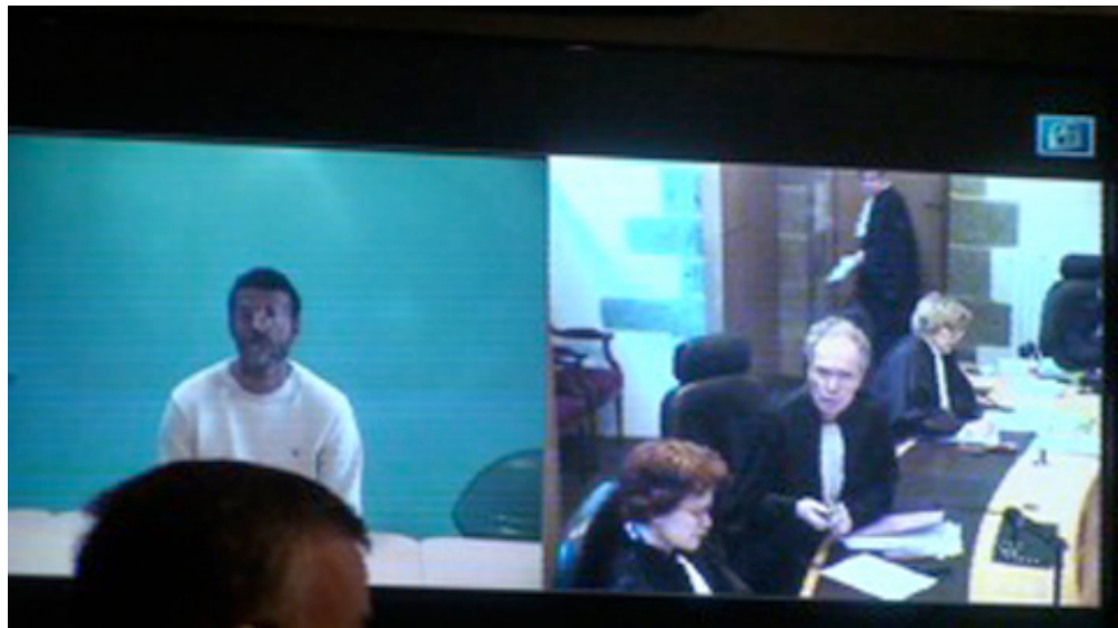
Le président a pris la télécommande. (L2)

La caméra se dirige vers l'avocat alors que le président annonce au prévenu que son avocat est dans la salle d'audience (L6 ; L9).