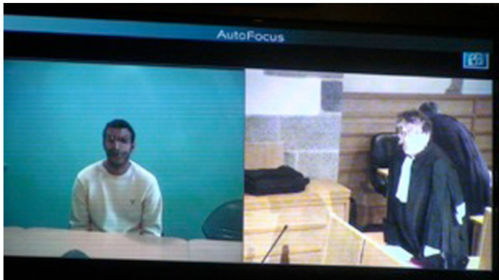
Le président modifie l'angle de vue de la caméra pour montrer l'avocat à l'écran (L8 ; 10).

Il ajuste ensuite l'angle de vue alors qu'il continue d'émettre quelques commentaires (L12-13). Puis il zoome sur l'avocat (L14-16) qui est alors bien visible sur l'écran et reconnaissable par son client.