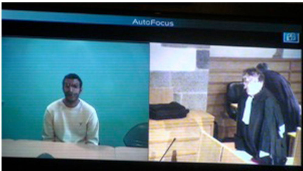
Le président modifie l'angle de vue de la caméra pour montrer l'avocat à l'écran (L8 ; 10).

Il ajuste ensuite l'angle de vue alors qu'il continue d'émettre quelques commentaires (L12-13). Puis il zoome sur l'avocat (L14-16) qui est alors bien visible sur l'écran et reconnaissable par son client.