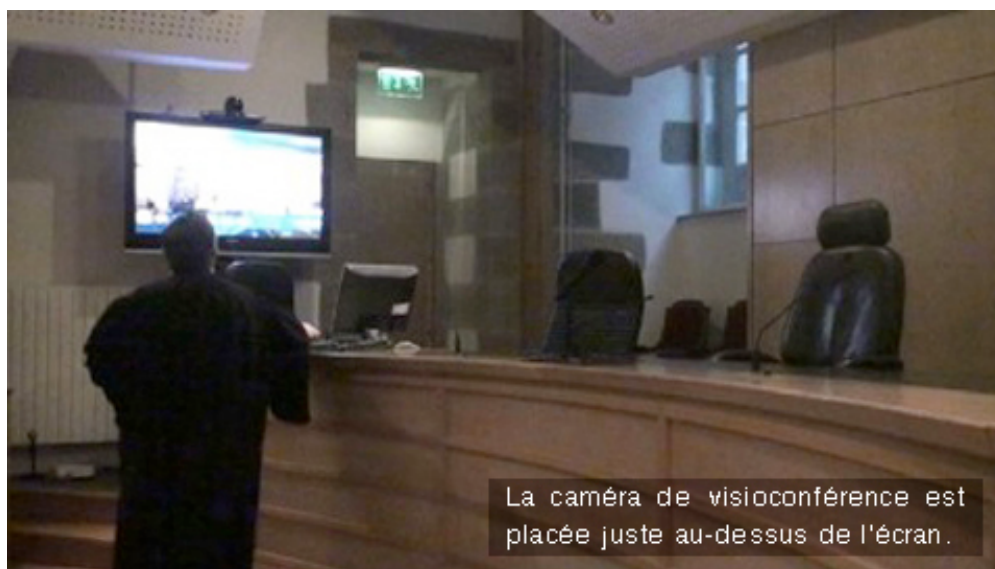
La caméra de visioconférence est placée juste au-dessus de l'écran.

Dans la salle de la chambre de l'instruction avant le début des audiences, l'huissier, connecte la chambre de l'instruction avec une maison d'arrêt. La caméra de vidéoconférence est placée juste au-dessus de l'écran. Lors d'une audience par visioconférence, l'écran visiophonique est séparé en deux, avec à gauche, l'image de la prison à droite, celle de la cour, qui est aussi celle qui est projetée dans la maison d'arrêt où se trouve le prévenu.