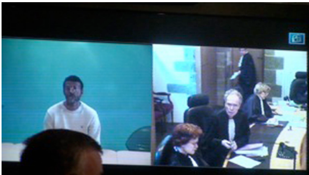
Le président a pris la télécommande. (L2)

La caméra se dirige vers l'avocat alors que le président annonce au prévenu que son avocat est dans la salle d'audience (L6 ; L9).