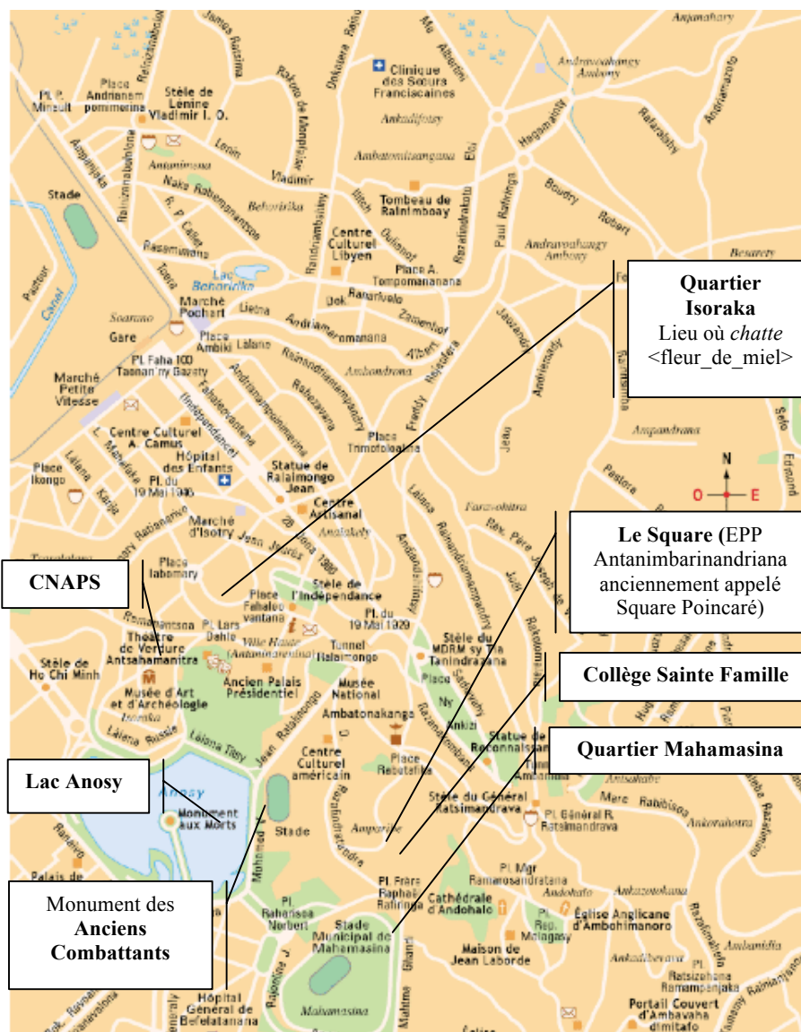
Plan du centre-ville de Tananarive

<fleurdemiel> commence à taper une réponse, qui est une proposition de se retrouver au monument aux morts, qu'elle appelle Anciens Combattants, situé sur le lac Anosy (L13) – à mi-chemin de celui que lui a proposé <ragassy> et de son collègue, et, par ailleurs, un lieu traditionnel de rendez-vous pour les couples. Nous indiquons sur la carte du centre-ville de Tananarive les différentes localisations citées dans cet extrait :