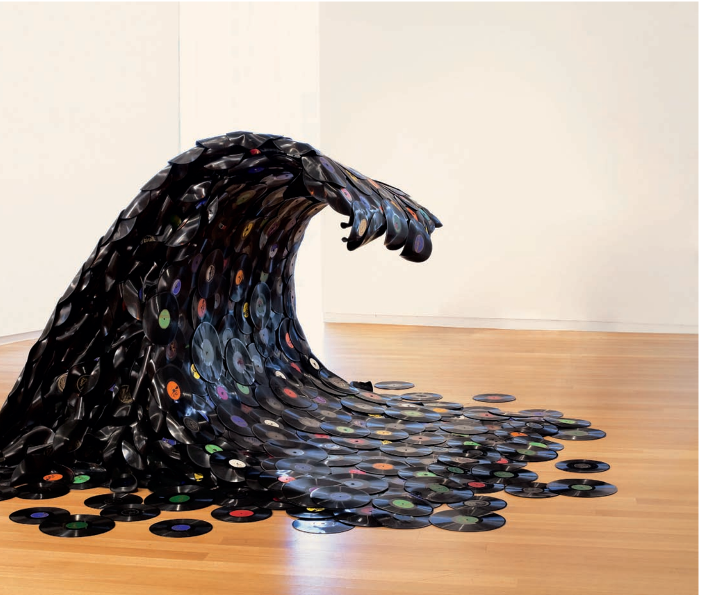
Fig. 5 Jean Shin, Sound Wave , installation au Museum of Arts & Design, New York, 2008.