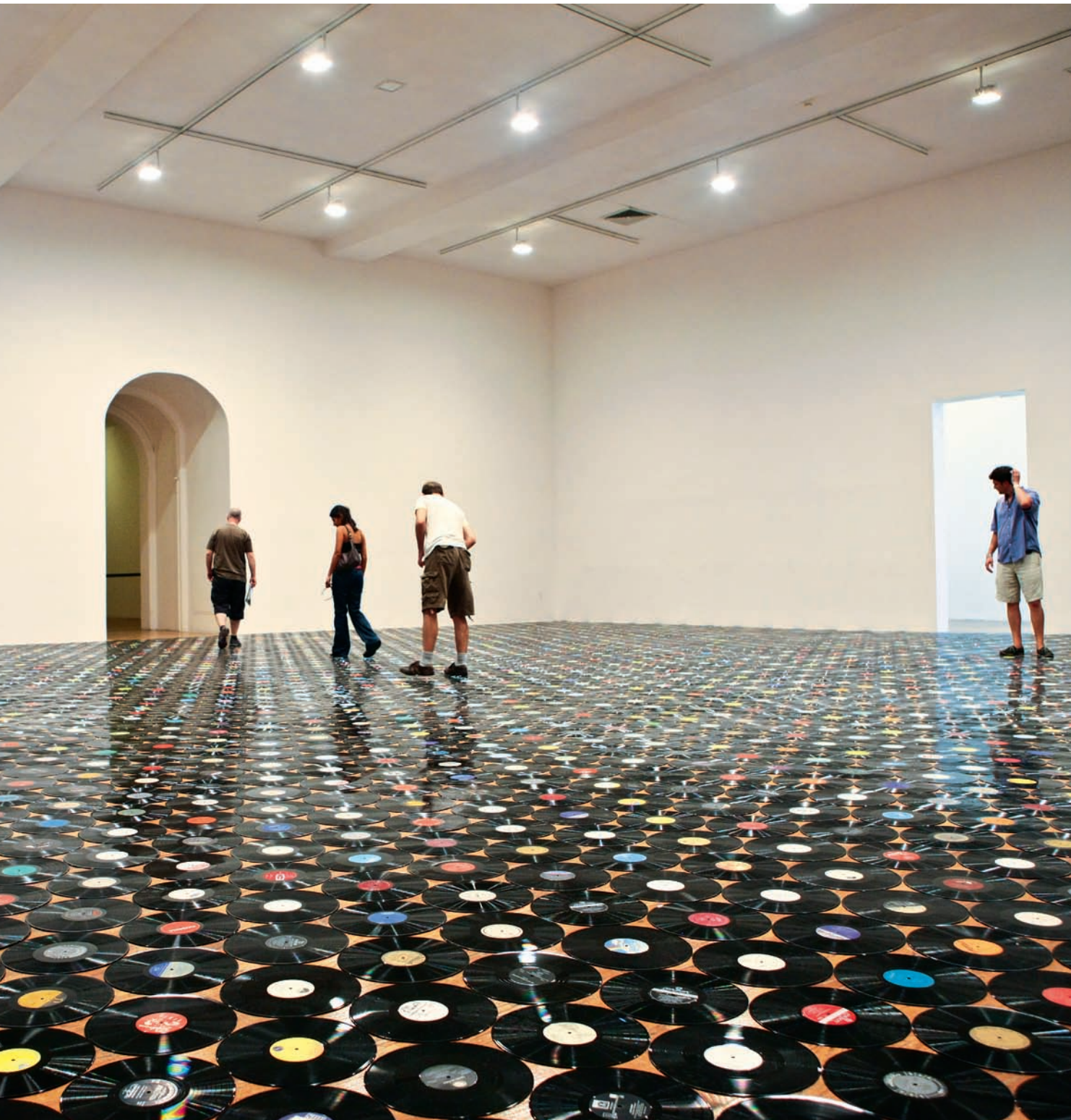
Fig. 2 Christian Marclay, vue de l'installation 2822 Records, 1987-2009, P.S.1 Contemporary Art Center, 2009, Long Island City, New York