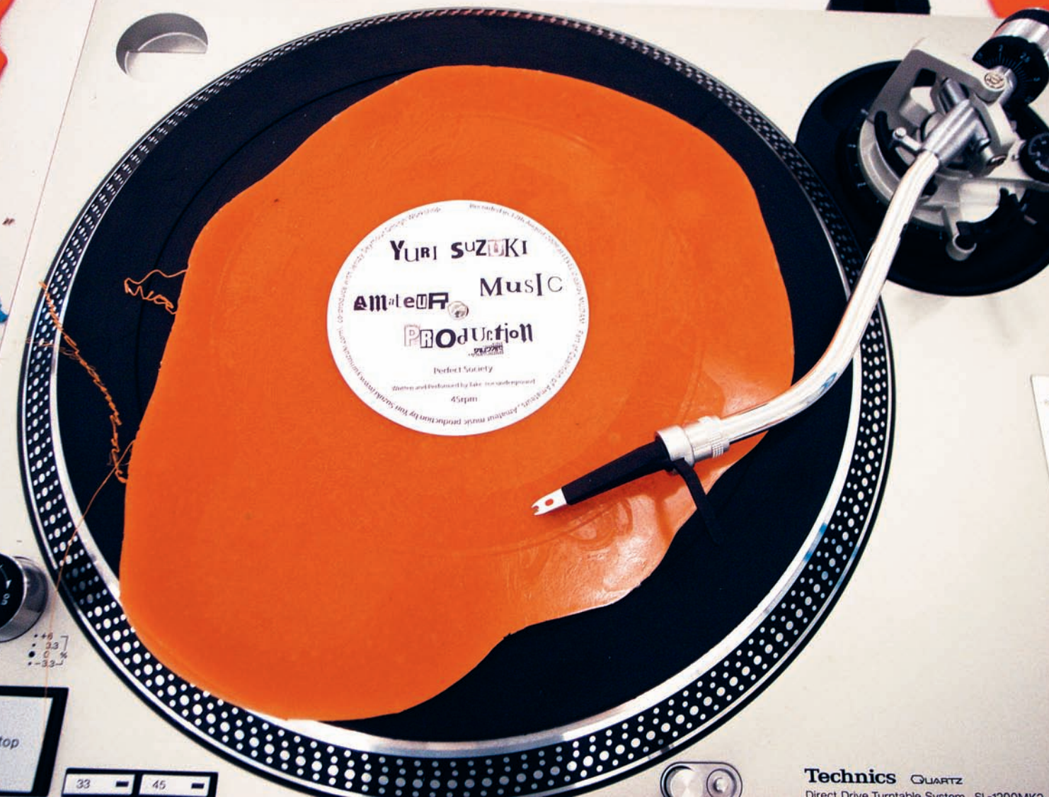
Fig. 3 Yuri Suzuki, Self Pressed Record , 2009, coproduit avec Jerszy Seymour Design Workshop © Yuri Suzuki ( www.yurisuzuki.com ).

L'originalité est un principe essentiel pour fonder le droit de propriété sur une œuvre. L'ensemble de ces exemples montre pourtant à quel point son emploi est problématique dans l'étude de la créativité en musique.