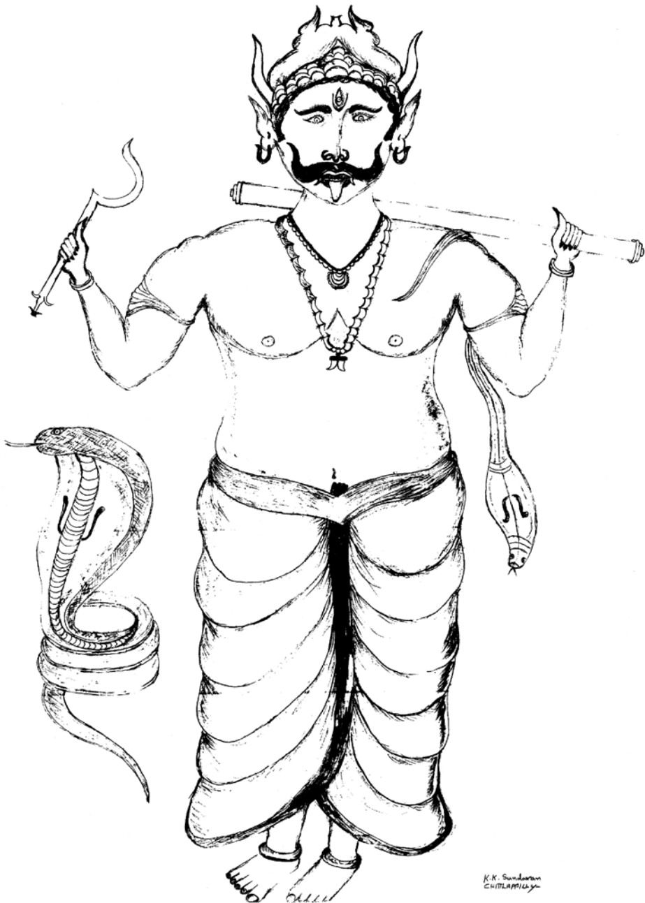
Fig. 4. Esquisse d'un Nāgabhūta kaḷam , par Puḷḷuvan K.K. Sundaran. Image: Christine Guillebaud, 2004.