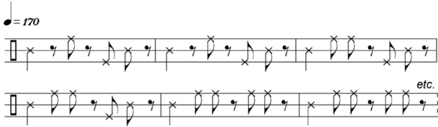
Fig. 10. Cycle lōkar « du peuple, populace »

Cette pièce évoque une femme lisant les lignes de la main, autrement dit une « gypsy », encore appelée localement la kuṛatti (et son équivalent masculin kuṛavan ). Cette caste, qui n'existe pas en réalité, est le fruit d'un imaginaire : elle représente l'altérité et l'extériorité, à la fois spatiale et sociale. Le kuṛavan et la kuṛatti sont en effet des êtres vivant dans la forêt (ou bien dans la montagne), milieu qui les disqualifie aussi en tant qu'êtres marginaux, dangereux et donc potentiellement comiques :