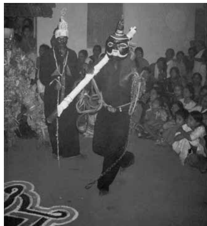
Fig. 7. Le bhūta Kālan «Le Noir» manifestant le Trépas.