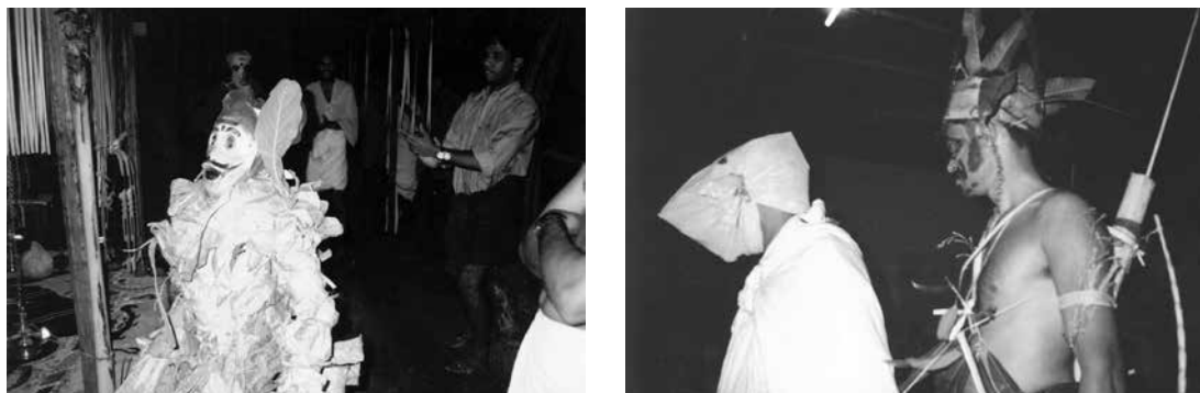
Fig. 5. Série de bhūta lors de rituels domestiques aux divinités serpents.

Durant le tracé, qui se déroule sur plusieurs heures, l'assemblée se limite au début à une poignée de participants. Les premières offrandes, elles, seront effectuées seulement quelques heures après la tombée de la nuit. Ce n'est qu'à partir de ce moment que le public, composé des membres de la famille étendue ( taravātu ) et de quelques voisins, vient s'installer au fur et à mesure que le canevas rituel se dessine, et dans l'enchaînement prédéterminé des actions menées autour du dessin 7 . Le climax de la soirée, moment le plus attendu, se laisse précisément saisir au vu du nombre de personnes présentes : les derniers participants s'installent effectivement peu avant l'arrivée annoncée des bhūta . À quoi tient la popularité de ces êtres apparemment frustrés et si négligemment accoutrés ? Leurs blagues incongrues, leurs costumes grotesques, leurs piteries ? Bien que