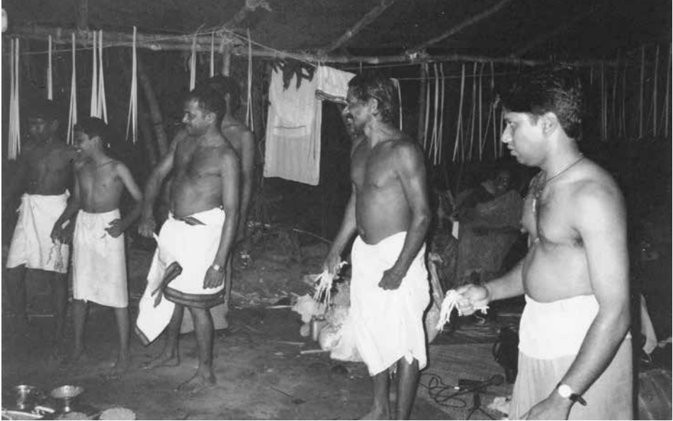
Fig. 11. Danse pūvāṭṭam par les hommes de la maison commanditaire. Photo : Christine Guillebaud, 2000