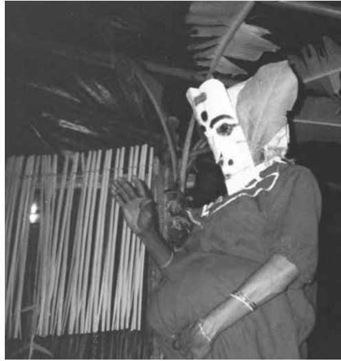
Fig. 9. Le bhūta Kāmaśi.

Saynète comique entre Puḷḷuvan Sudarman et le bhūta Kāmaśi « Celle qui désire » (une voix d'homme travestie). Enregistrement audio: Christine Guillebaud.