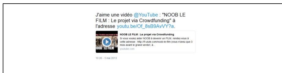
Figure 1. Capture d'écran tweet relayant la vidéo de lancement de la campagne Noob Le Film !

Dans le cas du projet Noob, Youtube semble être la plateforme la plus apte à propager le lancement de leur campagne. S'il paraît logique pour une web série de faire appel en premier lieu à cette plateforme, celle-ci permet aussi d'atteindre plus directement une audience invisible, seulement comptabilisée dans les « vues » des vidéos, et qui potentiellement ne se donnerait pas à voir ou à interagir sur d'autres dispositifs. En analysant les messages Twitter, nous observons donc que plus de 30% d'entre eux ne font que relayer automatiquement la vidéo de lancement diffusée, comme le montre le tweet suivant (Figure 1).