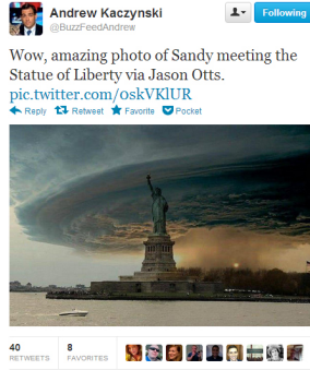
Figure 1. Exemple d'un tweet de la campagne MediaEval