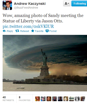
Figure 1. Exemple d'un tweet de la campagne MediaEval