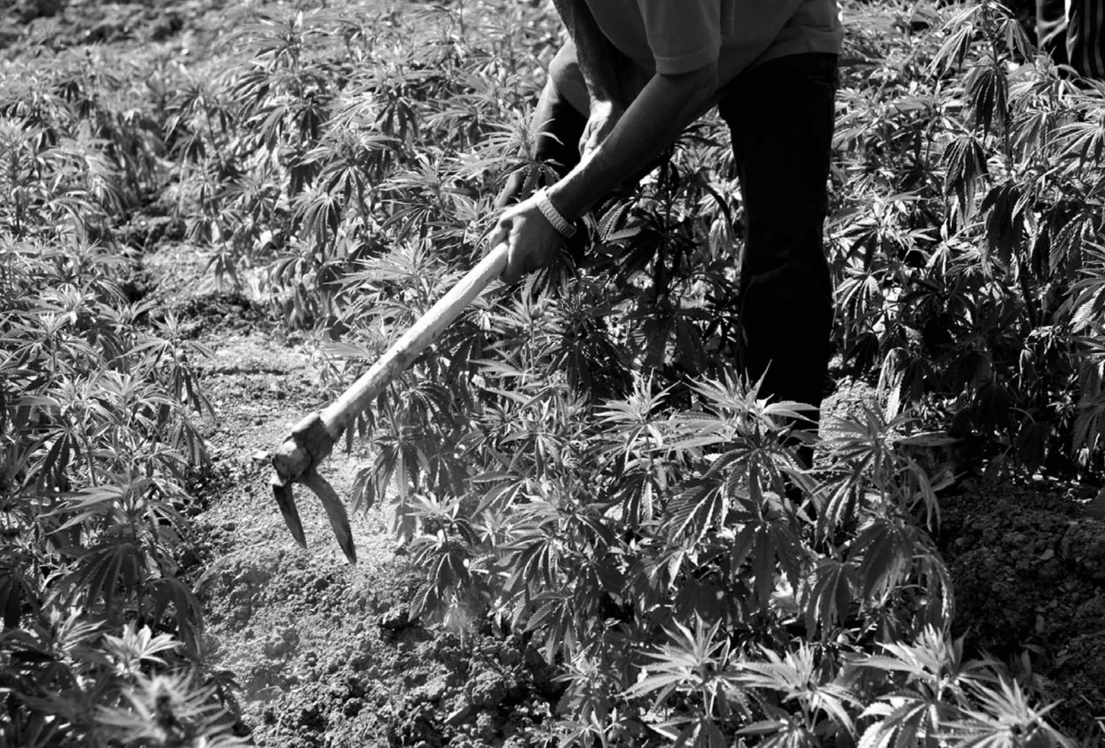
Binage d'un champ de Khardala