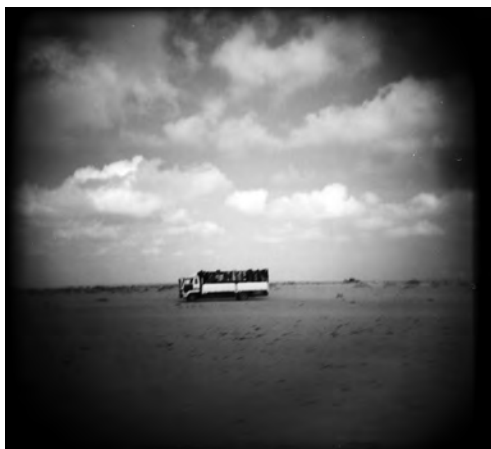
Fotografía n° 1 – Sergi Cámara (2008): La única salida . «Un camión de ACNUR traslada a los refugiados hacia Ahwar». Cortesía de Sergi Cámara.

Cada una de las 21 fotografías publicadas en el sitio web va acompañada de su leyenda para ofrecer un mínimo de contextualización 13 . Nos centraremos en el análisis de dos fotografías para volver a nuestra interrogación inicial y al cuestionamiento general sobre la translucidez de la imagen.