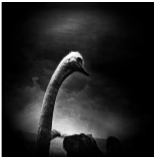
Fotografía n°4 – Francisco Mata Rosas: «Sin título». Cortesía del fotógrafo.

La textura de la imagen, lograda por el uso de una cámara de plástico, es la que permite la oscilación del animal entre vida y muerte, creando así una fotografía dinámica que cuestiona nuestra mirada y nos hace dudar de lo que estamos viendo: ¿un león vivo o un león expuesto en un museo? Nuevamente, la falta de precisión de la toma provoca interrogaciones y duda convirtiendo la reflexión del observador en una actitud muy activa.