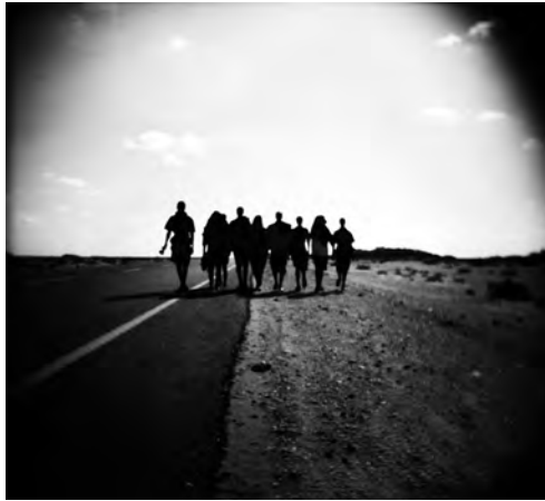
Fotografía n° 2 – Sergi Cámara (2008): La única salida . «Jóvenes somalíes se dirigen hacia Adén». Cortesía de Sergi Cámara.

visualmente; al poner en relación la soledad del vehículo en un paisaje árido con la contextualización dada por el pie de foto. Sergi Cámara ofrece una imagen de abandono que insiste en las difíciles condiciones de migración de los somalíes y etíopes retratados. El progresivo oscurecimiento de los tonos de grises del cielo, que ocupa los dos tercios superiores de la fotografía, crea una dramatización visual reforzando el tono de denuncia adoptado por el fotógrafo en su reportaje. Como la borrosidad de la imagen no deja ver con precisión los hombres, el observador tiene que aceptar la leyenda y hacer un esfuerzo de reconstrucción nítida de la toma. En este proceso activo para reenfocar la imagen, o hacerla más transparente, es cuando se crea una distancia entre la información recabada por Sergi Cámara y la información recibida.