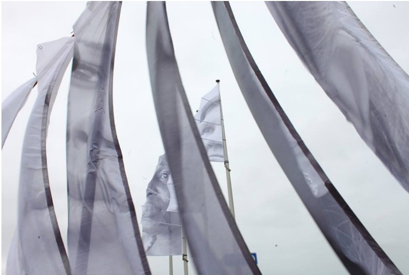
Illustration 1. Les voiles de l'inspiration, Dunkerque. Installation, 2013. Copyright Dailylife

dispositif d'un point de vue techno-sémiotique et des contenus d'un point de vue socio-culturel. C'est ainsi davantage l'aspect intuitif de la navigation qui a guidé la conception que la mobilité de son utilisation.