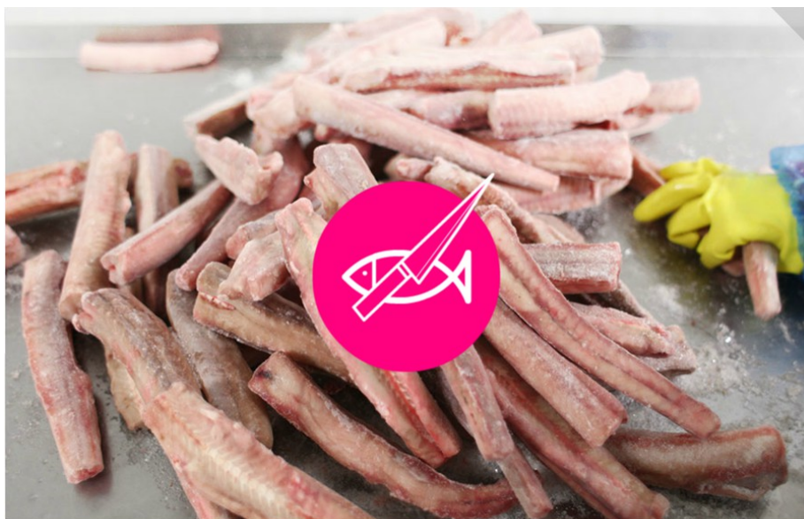
Illustration 3. La proposition de découpe de poisson

l'univers portuaire comme prétexte à la navigation. Il a par exemple proposé, pour passer d'une séquence à une autre, de « couper » l'écran en deux avec un couteau à poisson en ajoutant une animation sur une photographie prise dans une entreprise de découpe et de conditionnement de poissons (illustration 3). Cette proposition n'a pas été comprise par les femmes, habituées à préparer du poisson. L'une d'entre elles a pensé qu'elle allait pouvoir « découper » virtuellement un poisson, une autre attendait une recette de cuisine ; alors que le mouvement de découpe sur la tablette se traduisait simplement par le passage à la photographie suivante. Un problème complémentaire s'est alors posé car sur cette photographie figuraient des sachets de poisson surgelé. Les réactions ont alors été très négatives. Le rejet de la proposition a porté simultanément sur l'inadéquation du geste (« on ne coupe pas des sachets ») et sur la focalisation excessive sur des bâtons de poisson congelé.