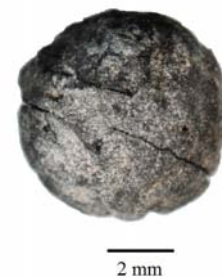
FIG. 1.5 : Fragment d'endocarpe carbonisé de jujube ( Ziziphus spina-christi/nummularia )