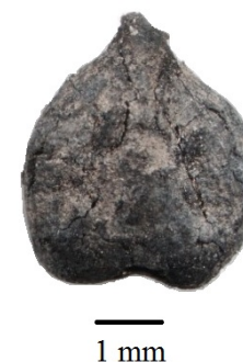
FIG. 1.6 : Pépin carbonisé de vigne en vue dorsale ( Vitis vinifera )