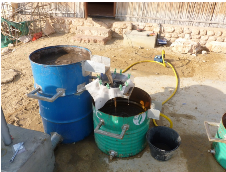
FIG. 1.3 : Machine à flottation

La mission archéobotanique menée en 2014 a mis en place un protocole d'échantillonnage sédimentaire et de traitement des prélèvements adapté par la méthode de la flottation. Par souci d'économie des réserves en eau, cette méthode a nécessité la construction d'une machine à flottation fonctionnant à l'aide d'une pompe électrique en circuit fermé (Figure 1.3).