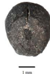
FIG. 1.4 : Caryopse carbonisée de sorgho ( Sorghum bicolor ) en vue dorsale