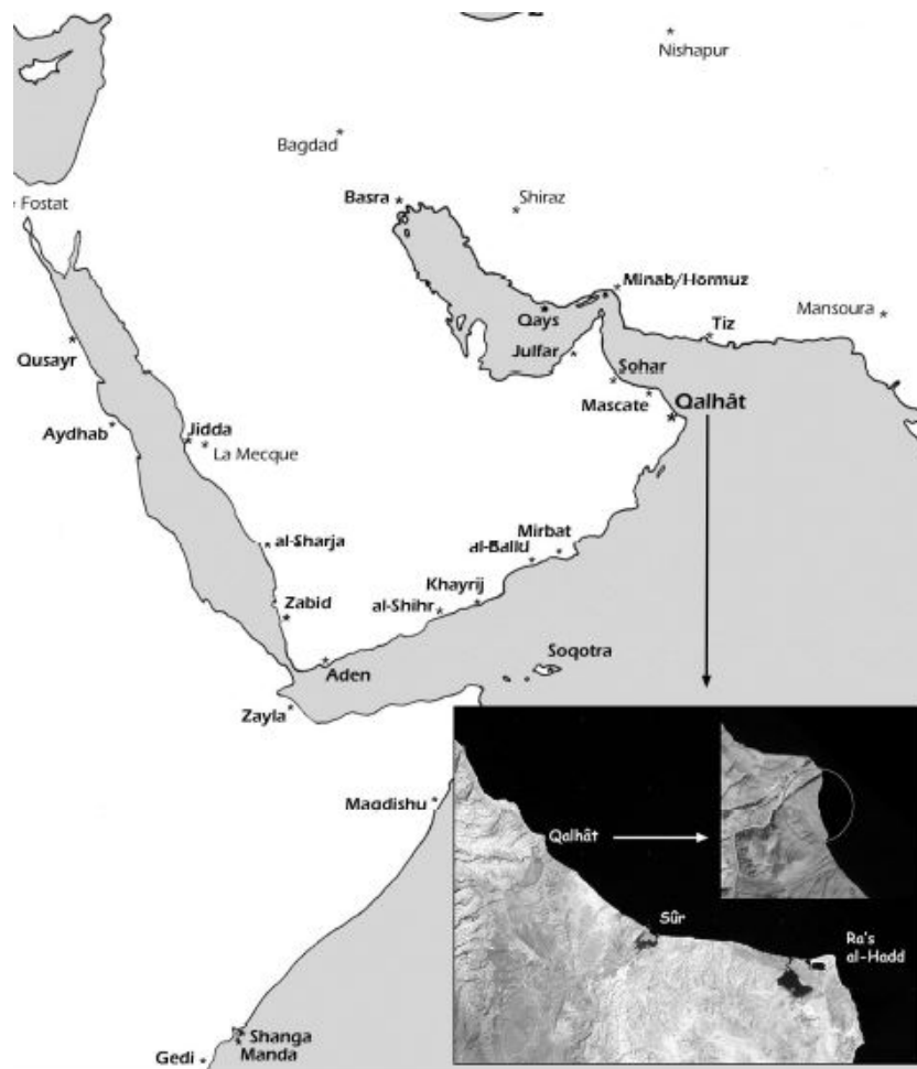
FIG. 1.1 : Localisation géographique du site de Qalhât (Rougeulle 2008)

LE SITE DE QALHÂT est localisé à une cinquantaine de kilomètres au nord du Ra's al-Hadd, point le plus oriental de la péninsule arabique, à proximité de la ville actuelle de Sûr (Province d'al-Sharqiya, Sultanat d'Oman) (Figure 1.1). Le site archéologique est implanté sur un plateau rocheux au pied du Jebel al-Hajjar, dominant la mer à l'est, le wadi Hilm et le village actuel au nord, et longé à l'ouest par les piémonts de la montagne au flanc de laquelle passe la nouvelle autoroute qui relie Mascate à Sûr. Le climat de cette région est aride avec des températures élevées et de faibles précipitations inégalement réparties sur l'année. Le couvert végétal actuel est réduit et consiste essentiellement en des arbres épineux ( Acacia ssp. , Ziziphus spina-christi/nummularia ) associés à des espèces arbustives et herbacées ( Lycium shawii , Tephrosia nubica , Pulicaria glutinosa , Suaeda verniculata ou encore Physorhynchus chamareapistrum ) (Pickering et Patzelt 2008).