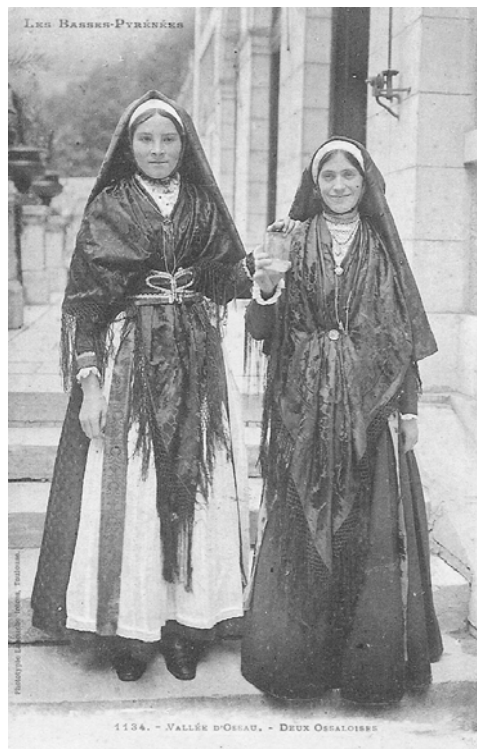
Figure 2. Vallée d'Ossau. Deux Ossaloises. La photographie, prise aux Eaux-Bonnes, montre deux façons différentes de porter le châle.

mode 10 . Selon les voyageurs et les ethnographes, le summum de la fête est la procession qui se déroule après les vêpres et à laquelle participent les Larunsois dans leur costume de fête. Saison après saison, les chroniqueurs du Courrier d'Eaux-Bonnes reprennent, sous une forme à peine remaniée et sans citer leur source, la description des costumes qu'avait donnée le Guide Joanne en 1858 11 en s'inspirant lui-même d'un ouvrage de 1844 12 . Le Guide omet rarement de préciser que les costumes se conforment « à l'antique mode du pays » 13 .