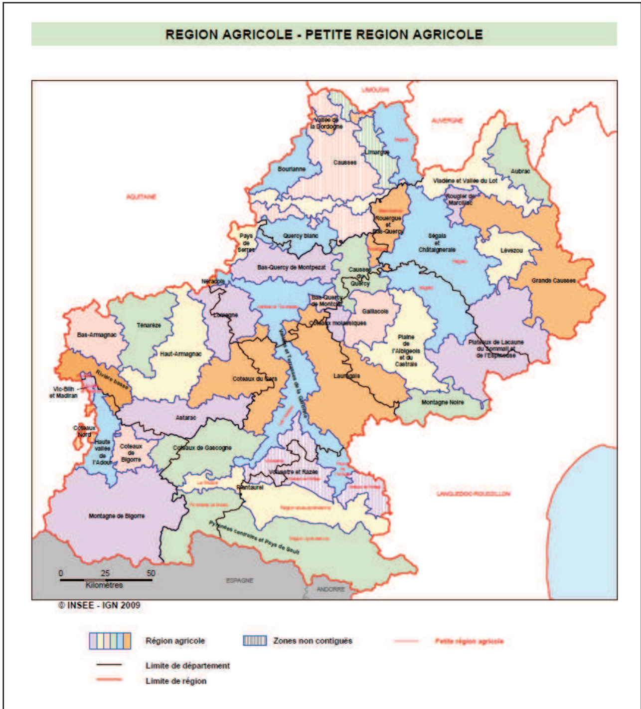
Figure 2 - Agricultural regions of Midi-Pyrénées.