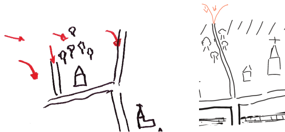
FIGURE 2. Différentes formes observables sur des esquisses

Quand le traitement d'image est fini, l'utilisateur doit visualiser les différentes esquisses pour vérifier et étiqueter les formes reconnues. Une première esquisse est affichée (voir figure 1 à gauche). Quand le curseur survole un élé-