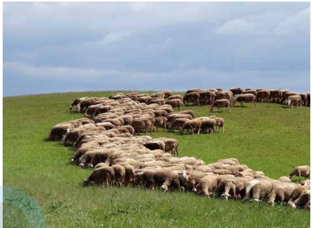
Pâturage de brebis sur un herbage cultivé de l'Aveyron.

Et si l'on mettait des vaches dans les champs cultivés ? L'idée peut sembler saugrenue, mais elle fait son chemin. Par exemple, une interculture de féverole ou de colza associés éventuellement à d'autres plantes et semés entre deux cultures principales peut être pâturée, plutôt que d'être roulée pour produire du mulch. Cette pratique permet à l'agriculteur d'introduire un troupeau sans pour autant accroître sa surface d'exploitation. Et améliorer ainsi la plus-value à l'hectare de certaines parcelles de son exploitation.