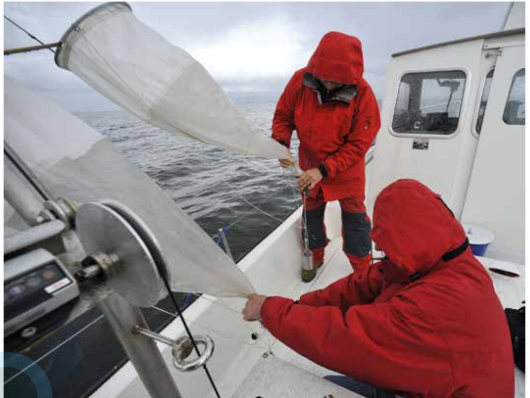
Centre alpin de recherche sur les réseaux trophiques des écosystèmes limniques (CARRTEL), Inra Thonon.

L'analyse des événements atypiques passés renseigne sur l'avenir. Et ce n'est pas rassurant. Tout porte à croire que les années considérées jusqu'alors comme très sèches ou très chaudes à l'échelle de la décennie, vont se banaliser à l'avenir. En clair, ce qui est aujourd'hui exceptionnel pourrait devenir la norme. Mais il reste une inconnue : quelles conséquences vont entraîner la succession de trois ou quatre années sèches sur une période de dix ans, notamment en agriculture ou sur le fonctionnement des écosystèmes aquatiques ? Les modèles mesurent de mieux en mieux l'impact de ces bouleversements, mais pas encore la façon dont les écosystèmes vont s'adapter sur le long terme.