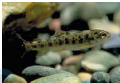
Reproduction du saumon atlantique, jeune saumon.

On peut également mentionner l'existence du réseau international RECOLAD de collaboration sur l'adaptation des animaux d'élevage au changement climatique. Son objectif : renforcer la capacité de recherche de l'Inra sur cette thématique et répondre à une demande forte des partenaires des « Sud » en termes d'appui au développement des filières animales.