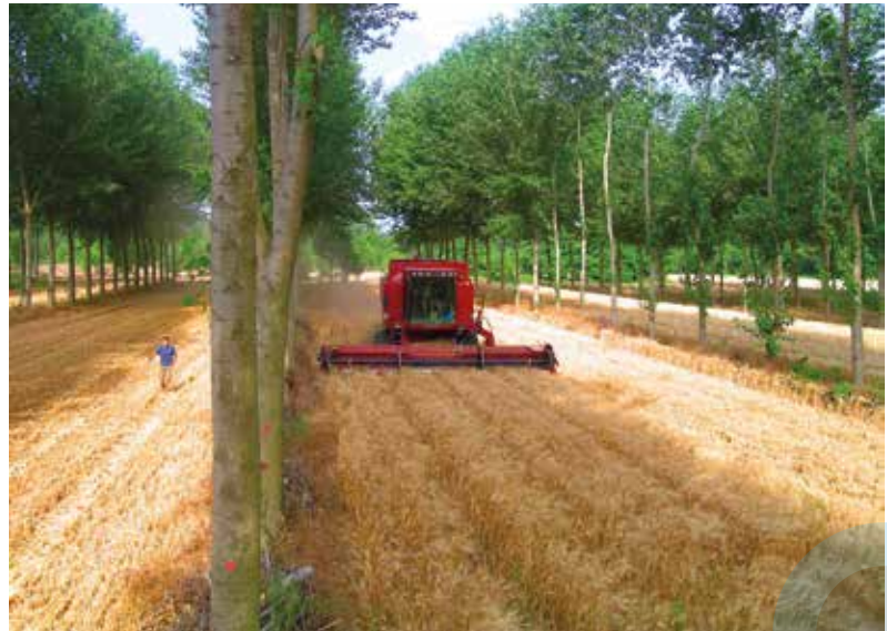
Moisson de blé dur dans une parcelle agroforestière expérimentale adulte près de Vézénobres dans le Gard. La complémentarité des arbres (ici des peupliers) et des cultures permet aux parcelles agroforestières d'être plus productives qu'un assolement de parcelles de cultures pures.