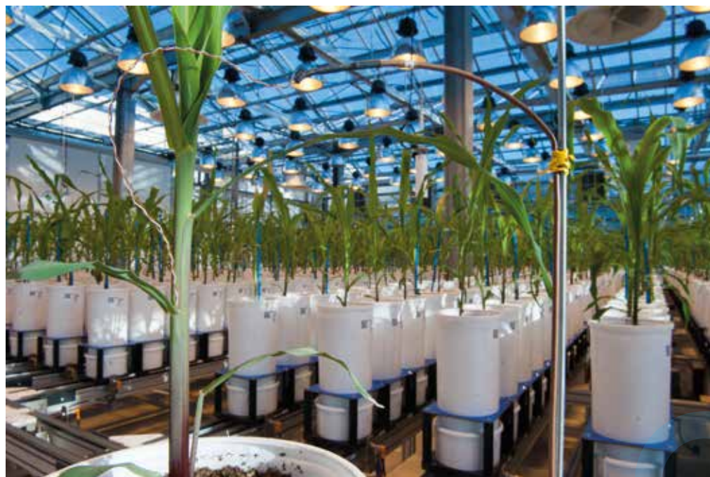
Sonde thermique (thermocouple) mesurant la température des organes d'une plante témoin de la plateforme PhenoArch.

Des chercheurs s'intéressent aux gènes qui pourraient offrir au maïs une résistance accrue au froid. À l'heure du réchauffement climatique, se préparent-ils pour la prochaine glaciation ? Non, certes. L'une des stratégies envisagées pour faire face à la diminution des ressources en eau, est d'avancer la date des semis afin que le maïs puisse être récolté avant que les conditions hydriques ne deviennent trop dures. C'est pourquoi un maïs adapté au froid pourrait être un atout. Ces travaux, comme ceux sur la sécheresse, sont réalisés dans le cadre du vaste projet Amaizing piloté par l'Inra (visant à développer des outils pour la création de variétés de maïs améliorées), mais aussi du projet européen DRIPS ( Drought-tolerant yielding plants ). Ce dernier a pour objectif de répondre aux problèmes soulevés par la raréfaction des ressources en eau grâce au développement de variétés de plantes plus résistantes à la sécheresse et/ou qui valorisent mieux l'eau d'irrigation ou des pluies.