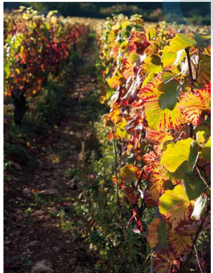
Vignoble de la Côte d'Or.

Dates de vendanges avancées, vins plus alcoolisés, moins acides, présentant de nouveaux profils aromatiques : les vignobles français ressentent déjà l'effet du réchauffement climatique. Le projet Laccave, lancé par l'Inra pour quatre ans en 2012 dans le cadre du métaprogramme ACCAF, réunit 23 laboratoires qui analysent les conséquences positives ou négatives des nouvelles conditions climatiques. Comment les viticulteurs peuvent-ils y faire face ? Quels scénarios pour les régions viticoles françaises en 2050 ? Voilà quelques-unes des questions que biologistes, pédologues, climatologues, économistes, agronomes et bien sûr, œnologues, se posent de concert. L'idée est d'apporter des connaissances qui permettront aux exploitants de s'adapter, mais aussi de tordre le cou aux oiseaux de mauvais augure qui nous annoncent la fin prochaine des vignobles français.