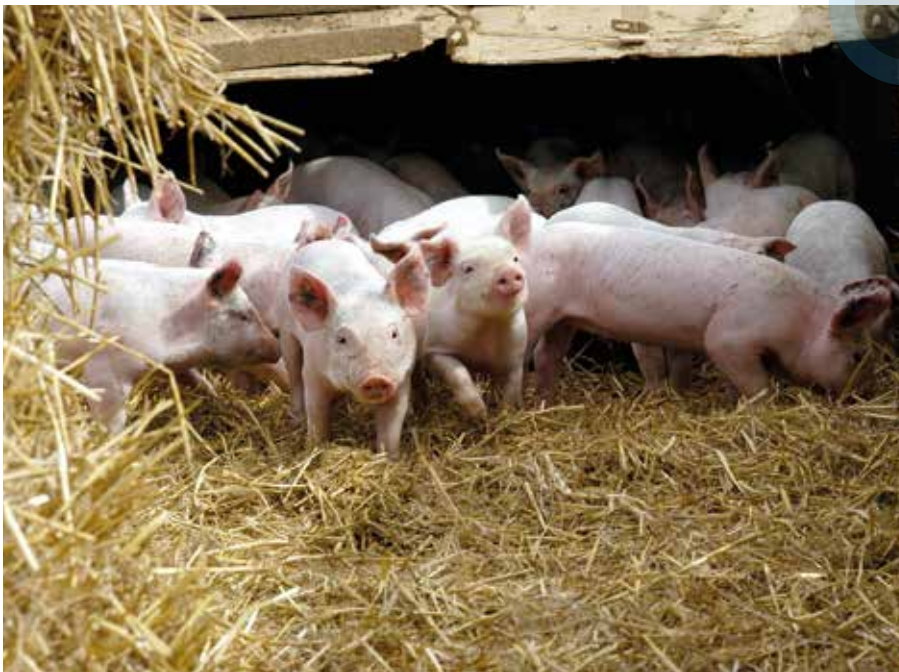
Élevage de porcs en plein air, cabane de post-sevrage avec litière de paille.

MAIS L'ÉLEVAGE EST AUSSI PORTEUR DE SOLUTIONS. DES PROGRÈS TANGIBLES ONT ÉTÉ EFFECTUÉS (LE SECTEUR BOVIN FRANÇAIS A NOTAMMENT RÉDUIT SES ÉMISSIONS DE 20% DEPUIS 1990) ET UN POTENTIEL D'ATTÉNUATION DU MÊME ORDRE DE GRANDEUR EST L'OBJECTIF POUR LES 15 PROCHAINES ANNÉES. GESTION DES EFFLUENTS, MÉTHANISATION, RÉDUCTION DE LA FERTILISATION, PÂTURAGE ET STOCKAGE DU CARBONE PAR LES PRAIRIES... LES LEVIERS SONT NOMBREUX ET FONT L'OBJET DE TOUTES LES ATTENTIONS À L'INRA.