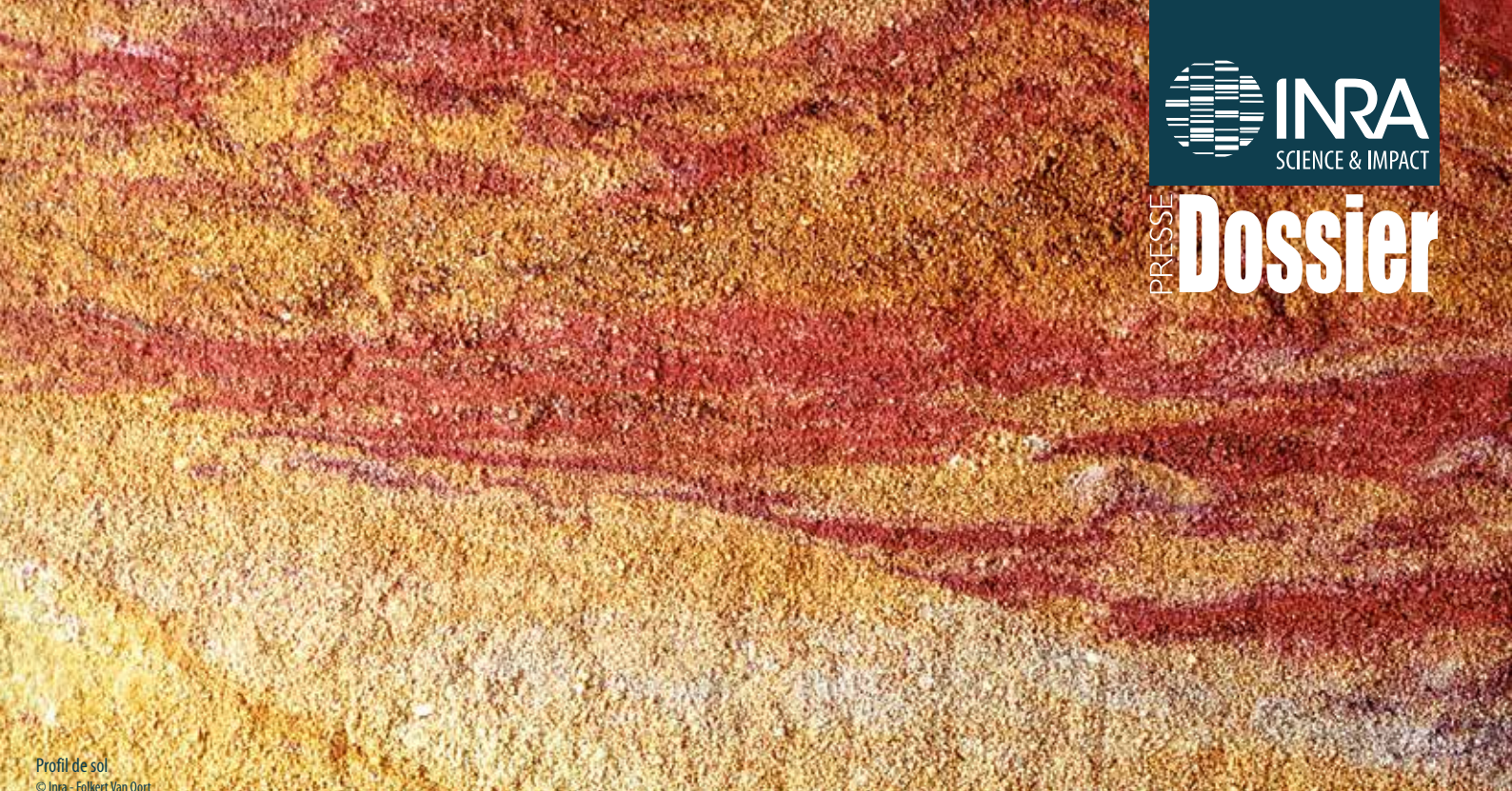
Profil de sol