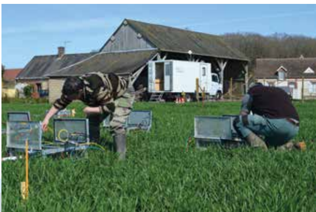
Dispositif expérimental à Illiers-Combray : chambres automatiques permettant de mesurer localement les flux de N_2O à la surface du sol.

exponentielle depuis l'industrialisation. Le gaz N_2O provient en grande majorité d'un mécanisme microbien (la dénitrification) qui se déroule, sous certaines conditions, dans les sols naturels et cultivés. Pour mieux comprendre comment, à quelle fréquence et en quelles quantités se produisent les émissions de N_2O par les sols agricoles, une équipe de chercheurs français et allemands a étudié le phénomène en conditions réelles de pratiques agricoles. Durant six semaines, au printemps 2015, ils ont mesuré les émissions de N_2O en continu sur une zone de 3 km 2 près d'Illiers-Combray, en Eure-et-Loir. Des mesures très locales, sur des zones mesurant quelques dm 2 , ont également été réalisées. Cette expérimentation a pu être menée grâce au développement de nouveaux instruments de mesure capables de détecter d'infimes concentrations en N_2O . Car, en effet, les émissions de ce gaz sont très difficiles à quantifier, en raison de leur caractère fugace dans le temps et dans l'espace. D'ici quelques années, ces travaux permettront de limiter les émissions de N_2O par les sols tout en respectant la production agricole.