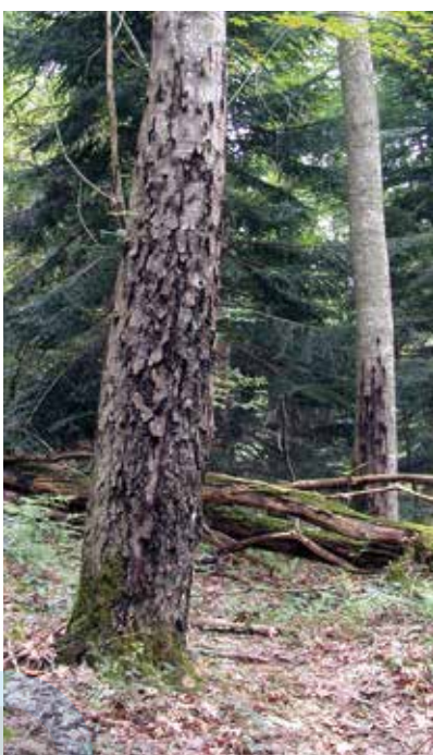
La maladie de l'encre du chêne.

Depuis une vingtaine d'années, certaines essences de pins, notamment le pin laricio, sont attaquées par une famille de champignons du genre Dothistroma . Appelée maladie des bandes rouges à cause des motifs qui se dessinent sur les aiguilles des arbres attaqués, elle entraîne une réduction drastique de leur croissance. Cette maladie, qui s'étend en France, remet en question les peuplements de pins laricio qu'il faudra peut-être remplacer par des espèces plus résistantes. Néanmoins, les chercheurs de l'Inra tentent de déterminer les conditions (humidité, densité des forêts) qui freinent la propagation de Dothistroma .