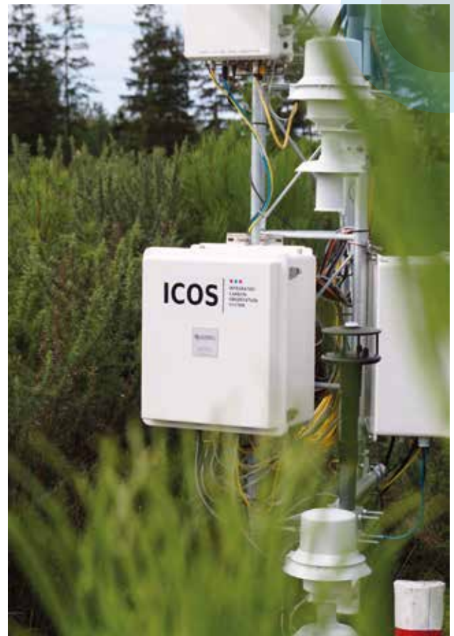
Station ICOS à Pierroton.

À l'heure actuelle, le milieu agricole ou forestier ne participe pas au système européen d'échange de quotas d'émissions de GES. Et pour cause, les émissions agricoles et forestières émanent de nombreuses sources différentes : bétail, végétation, engrais, incendies, ce qui ne facilite pas leur contrôle. Pour un agriculteur ou un forestier, il est compliqué de montrer que son activité est vertueuse et qu'il met en œuvre des moyens de réduction des émissions de GES. À l'avenir, les services proposés à partir des données observées par l'infrastructure ICOS pourraient permettre aux acteurs locaux (régions, syndicats d'exploitants...) de mesurer précisément leur impact sur le climat et faciliter l'accès au marché du carbone.