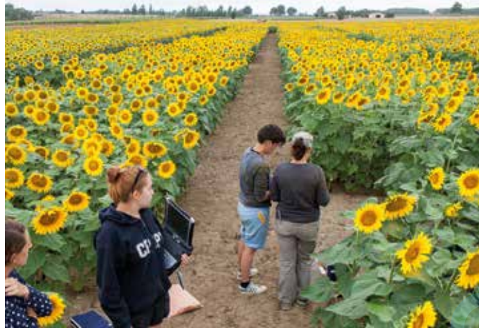
Phénotypage d'une population de tournesols pour la découverte des gènes impliqués dans la tolérance à la sécheresse par une équipe de SUNRISE.

Le tournesol devra faire face à une demande croissante au cours des trente prochaines années du fait de la qualité de son huile oléique (faible teneur en oméga 6) et de la richesse en protéines des tourteaux décortiqués. Depuis 2012, neuf laboratoires de recherche, six entreprises impliquées dans l'industrie semencière, et l'Institut Technique Terres Inovia se sont associés au sein du projet SUNRISE. L'objectif pour 2020 est d'améliorer la production, dans des conditions de culture adaptées au changement climatique et respectueuses de l'environnement en fournissant aux agriculteurs de nouvelles variétés tolérantes à la sécheresse, et à l'ensemble de la filière des outils et des méthodes permettant de mieux maîtriser la culture du tournesol.