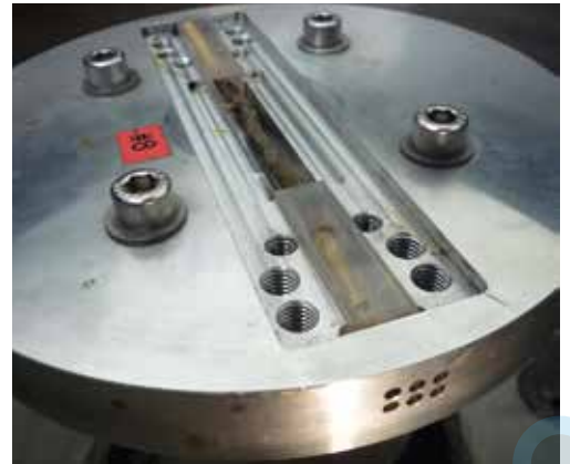
Le Cavitron : un prototype d'instrument de mesure capable de caractériser la tolérance à la sécheresse des arbres via la mesure de la conductance hydraulique d'un rameau sous pression négative.

Publiée dans la revue Nature en 2012, la nouvelle n'avait rien de réjouissant : une équipe de chercheurs pilotée par l'Inra démontrait que les arbres de la planète, d'où qu'ils soient, fonctionnent à la limite du point de rupture de leur système hydraulique. L'explication physiologique est simple : le long des troncs des arbres, la sève circule à travers des vaisseaux situés sous l'écorce. Mais lorsqu'une bulle d'air vient rompre la colonne d'eau dans l'un de ces vaisseaux, celui-ci est irrémédiablement perdu. Cette embolie, que les chercheurs appellent cavitation, survient lorsque l'arbre subit un stress hydrique. Elle conduit à la mort de l'arbre lorsqu'elle s'étend à trop de vaisseaux. Mais voilà : chaque espèce a une résistance à la cavitation adaptée à son milieu naturel. Du coup, tant les forêts tropicales que les forêts méditerranéennes devraient également souffrir des sécheresses à répétition que nous promettent les modèles climatiques.