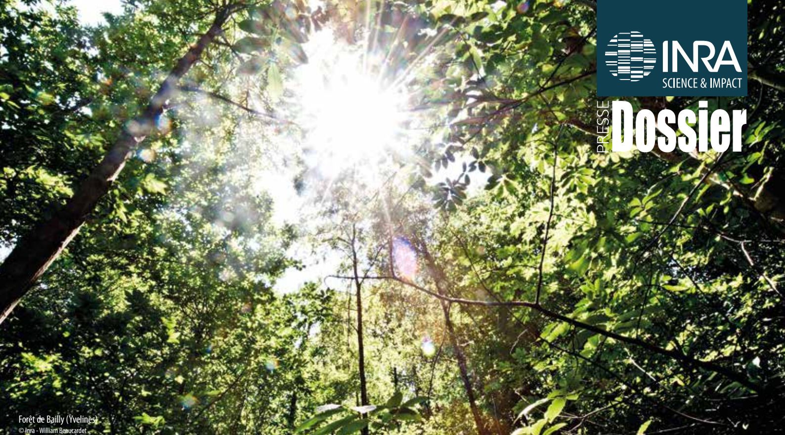
Forêt de Bailly (Yvelines)