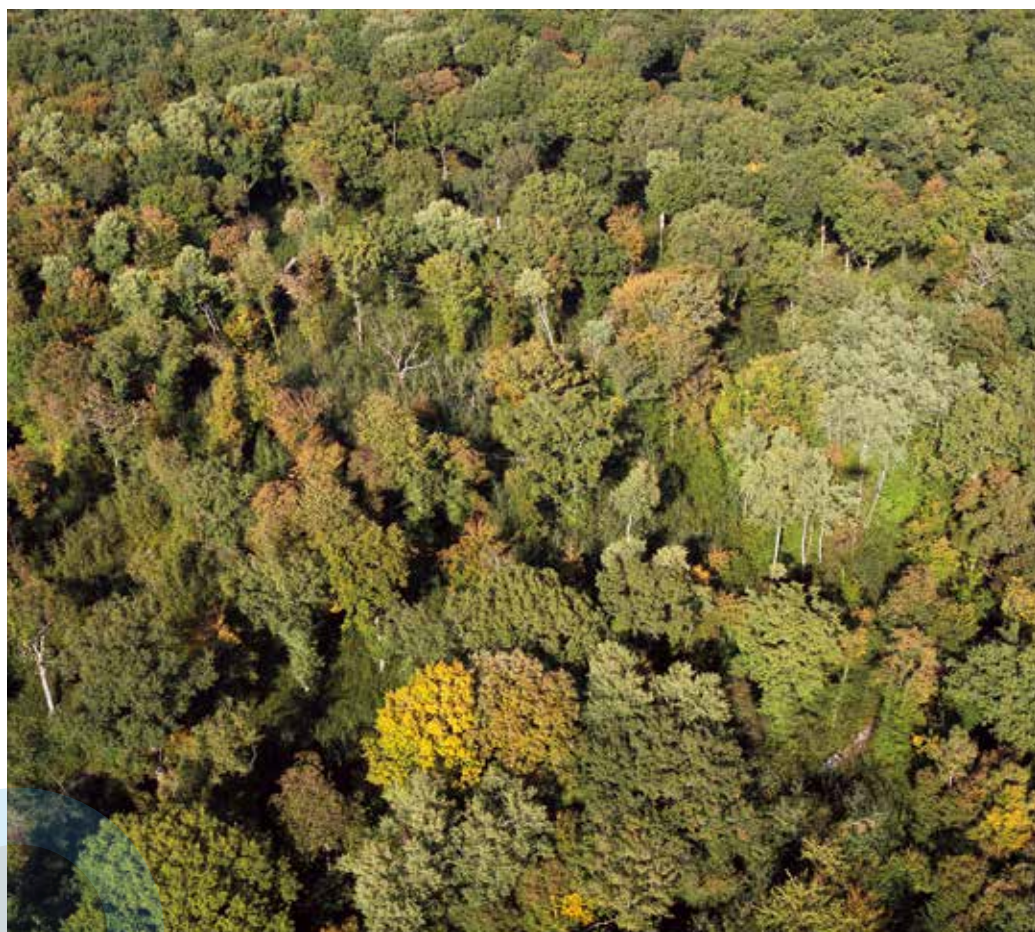
Vue aérienne de la canopée d'une forêt proche de Chalon-sur-Saône en Bourgogne.

Les plaines du Sud-Ouest sibérien, où le thermomètre affiche facilement -35^{\circ}\text{C} en hiver, deviendront-elles de nouvelles terres agricoles ? C'est l'hypothèse explorée par une équipe de scientifiques dans le cadre du projet A-WEST-CC. Le changement climatique devrait entraîner une augmentation des précipitations neigeuses dans cette région de la Russie. La couche de neige pourrait alors jouer le rôle d'une couverture isolante empêchant le sol de geler. Celui-ci pourrait alors conserver une activité microbienne minimale. Dès le retour du printemps, la reprise d'une importante activité microbienne serait beaucoup plus rapide, améliorant la décomposition de la matière organique et la libération de nutriments tels que l'azote. L'accroissement des quantités de neige pourrait aussi constituer un apport supplémentaire d'eau favorable à la croissance des plantes dans les zones les plus sèches. Ainsi, si ce gain de fertilité est suffisant et si les infrastructures suivent, on pourrait assister bientôt à l'éveil agricole de cette vaste région.