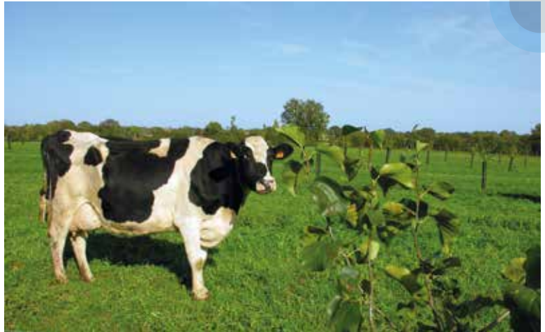
Parcelle en agroforesterie d'élevage.

Un des nouveaux défis des systèmes laitiers : produire du lait dans un contexte de contraintes et d'aléas climatiques, en économisant les ressources en eau et en énergie fossile, et tout en contribuant à une agriculture durable. Dans ce contexte, l'Inra a mis en place, en juin 2013, un projet baptisé OasYs sur 90 hectares de prairies et de cultures en Poitou-Charentes, avec un troupeau laitier de 72 vaches. Il est fondé sur une diversification des ressources fourragères (y compris des arbres), le développement du pâturage et des légumineuses, le recyclage de l'eau et des éléments nutritifs ainsi que sur une stratégie d'élevage adaptée (période de reproduction, durée de lactation, génotypes). En bref : un système agroécologique global à l'échelle de l'exploitation.