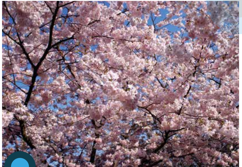
Cerisiers en fleurs.

Le changement climatique est aujourd'hui si rapide que les arbres fruitiers n'ont même plus le temps de s'adapter aux nouvelles conditions météorologiques, ce qui menace leur survie future. En exploitant les observations gérées par l'unité Agroclim de l'Inra Paca, les généticiens de l'Inra d'Avignon, Bordeaux et Montpellier, s'efforcent donc d'identifier les gènes impliqués dans les différents stades de la phénologie. Avec un but précis : sélectionner les arbres les mieux adaptés au climat futur de leur région de production. Mais le graal des généticiens, c'est la création de l'arbre résilient, une variété dont la phénologie peut s'adapter à n'importe quelle perturbation climatique. Pour cela, il va falloir patienter encore quelques années.