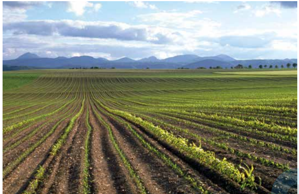
Culture de maïs (environs de Riom dans le Puy-de-Dôme).