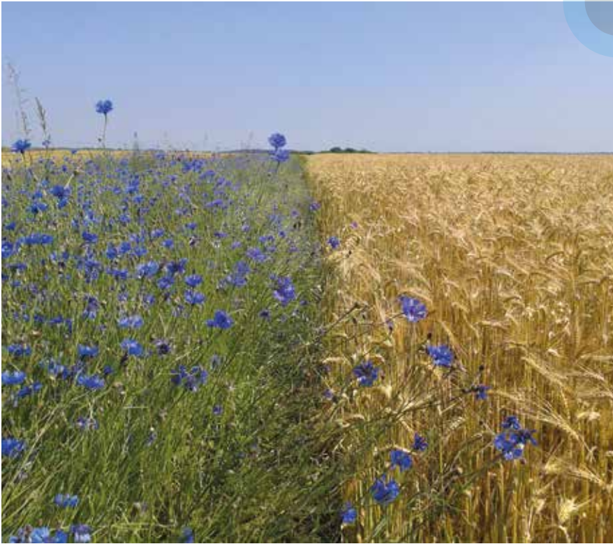
Bande fleurie de bleuets dans un champ d'orge.