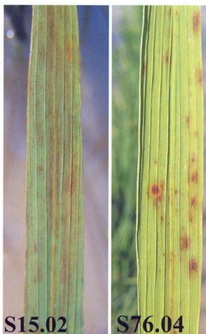
Figura 2.- Hojas de plantas de las líneas S15.02 y S76.04 que presentan manchas necróticas en ausencia de patógeno.

ficado varias líneas que desarrollan lesiones espontáneas de las cuales este año ya hemos confirmado diez. En general estas líneas presentan un fenotipo normal exceptuando la aparición de manchas, con las hojas verdes y el grano sano. No todas las líneas desarrollaron manchas en invernadero pero sí en campo abierto. Esta observación no es sorprendente ya que la aparición de manchas necróticas, en ocasiones, es dependiente de factores ambientales como la humedad, la agresión mecánica (ej. viento) y en consecuencia no suelen aparecer cuando la planta es crecida en ambiente controlado. Cabe mencionar que las plantas que no desarrollaron manchas presentaron un aspecto muy saludable permaneciendo verdes más tiempo que las plantas control.