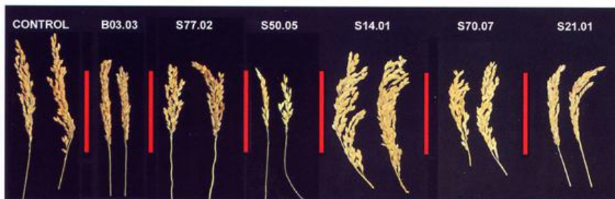
Figura 3.- Varias líneas mutantes presentaron variaciones en la cantidad o distribución de los granos en las espigas.

ficado varias líneas que desarrollan lesiones espontáneas de las cuales este año ya hemos confirmado diez. En general estas líneas presentan un fenotipo normal exceptuando la aparición de manchas, con las hojas verdes y el grano sano. No todas las líneas desarrollaron manchas en invernadero pero sí en campo abierto. Esta observación no es sorprendente ya que la aparición de manchas necróticas, en ocasiones, es dependiente de factores ambientales como la humedad, la agresión mecánica (ej. viento) y en consecuencia no suelen aparecer cuando la planta es crecida en ambiente controlado. Cabe mencionar que las plantas que no desarrollaron manchas presentaron un aspecto muy saludable permaneciendo verdes más tiempo que las plantas control.