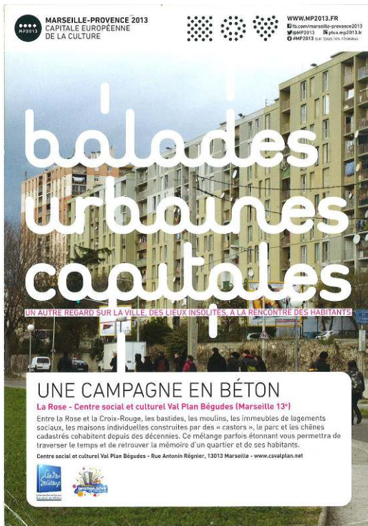
Illustration 4 : Balade urbaine capitale

Dépliant faisant la promotion de la « balade urbaine capitale » proposée par le Centre social de Val Plan Bégudes dans le cadre de MP13. « Un autre regard sur la ville, des lieux insolites, à la rencontre des habitants », y vante-t-on. Un autre regard sur « sa » ville, des lieux insolites au sortir de « chez soi », à la rencontre « de ses voisins », tout compte fait.