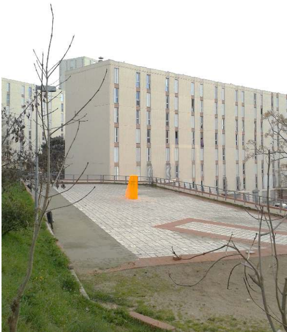
Une deuxième œuvre d'art contemporain au cœur d'une cité des quartiers nord de Marseille. Photographie : Yannick Hascoët, février 2014