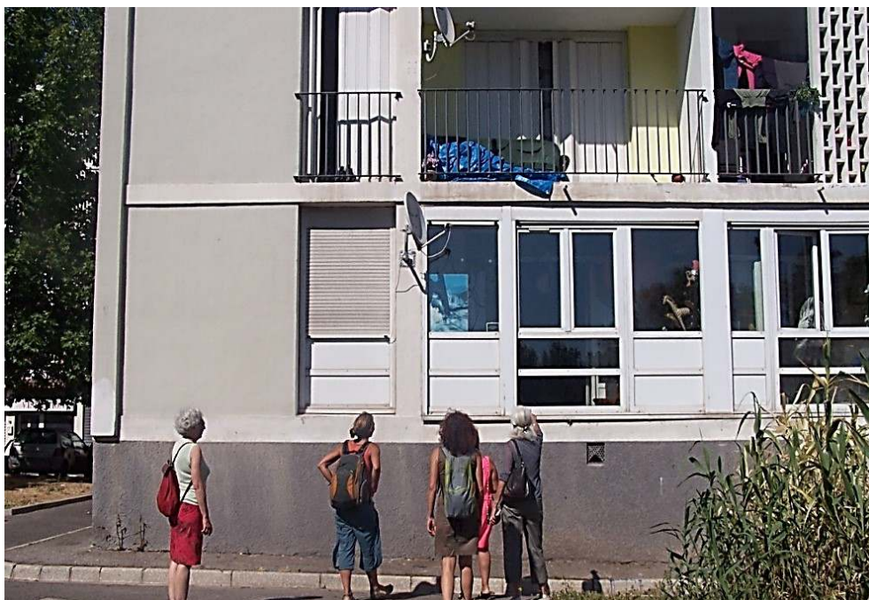
Photographie : Yannick Hascoët, juin 2013

ILLUSTRATION 2 : Un groupe en visite à la cité de La Visitation dans le cadre de l'Offre « Terroir des cités » de l'Hôtel du Nord