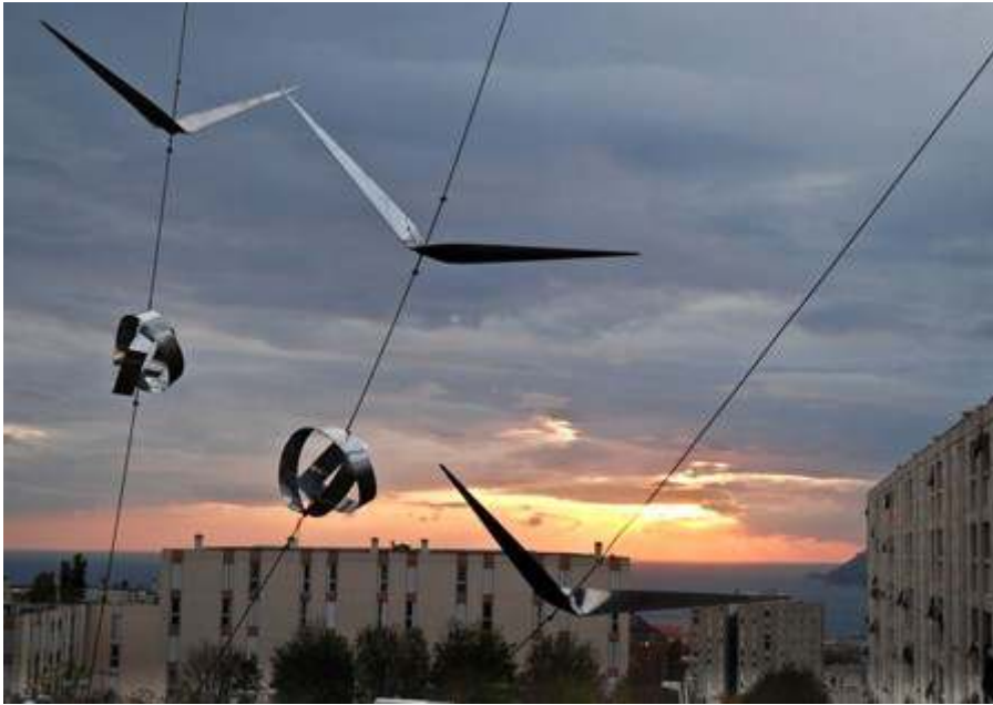
Une œuvre d'art contemporain au cœur d'une cité des quartiers nord de Marseille.