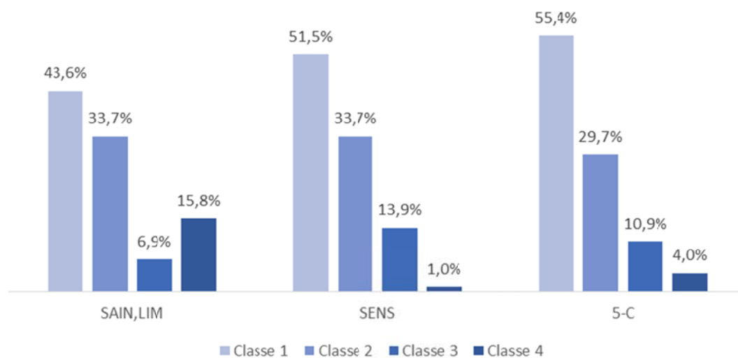
Figure 1. Répartition de recettes (n=101) dans les 4 classes pour chacun des trois systèmes de profilage nutritionnel : SAIN,LIM, SENS et 5-C.